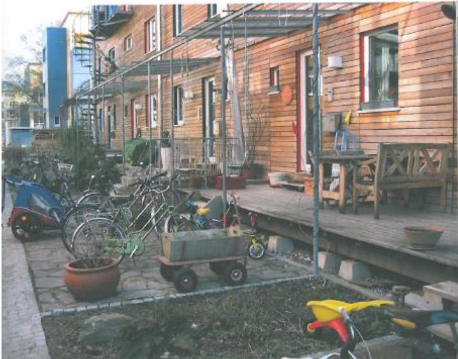
Exemple 1 de frontage.