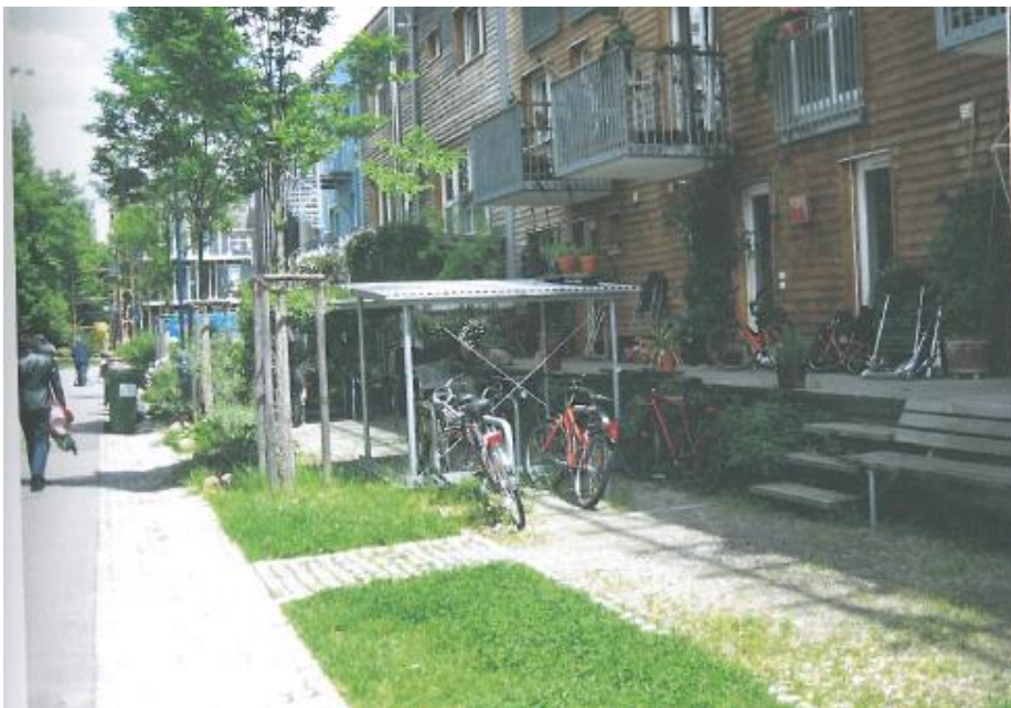
Exemple 2 de frontage.

Ces espaces ne sont pas exempts de conflits, c'est pourquoi leur usage doit être médiatisé en permanence par des règles et par des médiateurs/trices sociaux/ales au début.