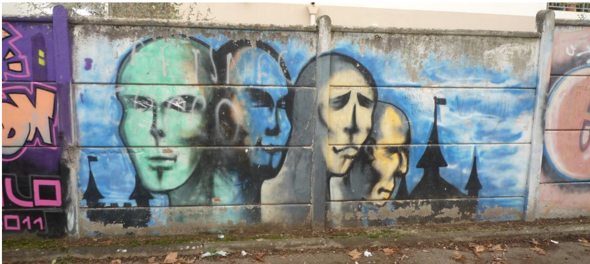
Détail de la fresque du mur d'accès à la MJC Laennec-Mermoz (Lyon 8 ème ).

Non/-recours aux offres socio-éducatives et de loisir, place dans l'espace public et ethnicisation des rapports sociaux (de sexe)