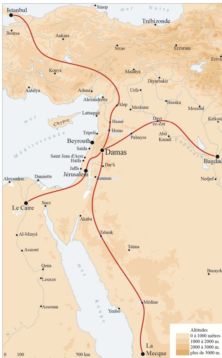
Figure 1. Damas : un carrefour de voies au long cours. Entre Istanbul et La Mecque, entre Bagdad et Le Caire, à la fin du XVIII e siècle, Damas est un des principaux carrefours du Proche-Orient. Dessin de l'auteur.

moins de 20 000 à 50 000 qui regagnent Damas par l'intermédiaire de trois caravanes d'origines différentes : de Perse, d'Anatolie et des Balkans. Après une arrivée en ordre dispersé et un séjour plus ou moins prolongé au cours duquel ils se livrent à de multiples transactions pour préparer la suite de leur voyage, les pèlerins partent pour le Hedjaz sous la direction du gouverneur de la province. Trois ou quatre mois plus tard, ils reviennent à Damas d'où ils se séparent avant de reprendre la route 5 .