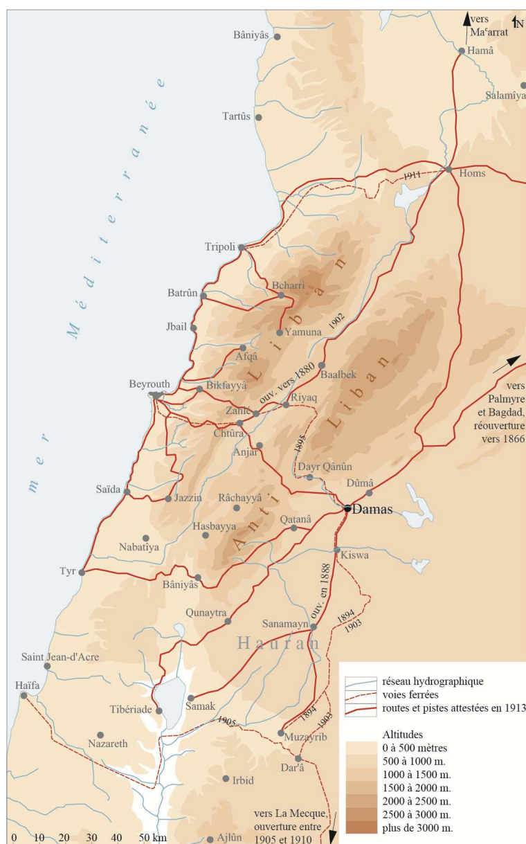
Figure 4. Voies de communication des environs de Damas en 1913. A la veille de la Première Guerre mondiale, on compte plus de 3 000 km de routes carrossables dans la région de Damas, cette carte témoigne de l'ampleur des travaux réalisés au cours du demi-siècle précédent. Dessin de l'auteur d'après Notice sur la Syrie , 1916, Paris, Hachette.

Bâniyâs (47 km) est qualifiée de mauvaise, c'est plutôt un chemin de caravanes, elle compte de nombreux gués et des sections de chemins pierreux. L'auteur montre aussi que de nombreuses routes manquent d'entretien, en particulier depuis l'ouverture des nouvelles voies ferrées.