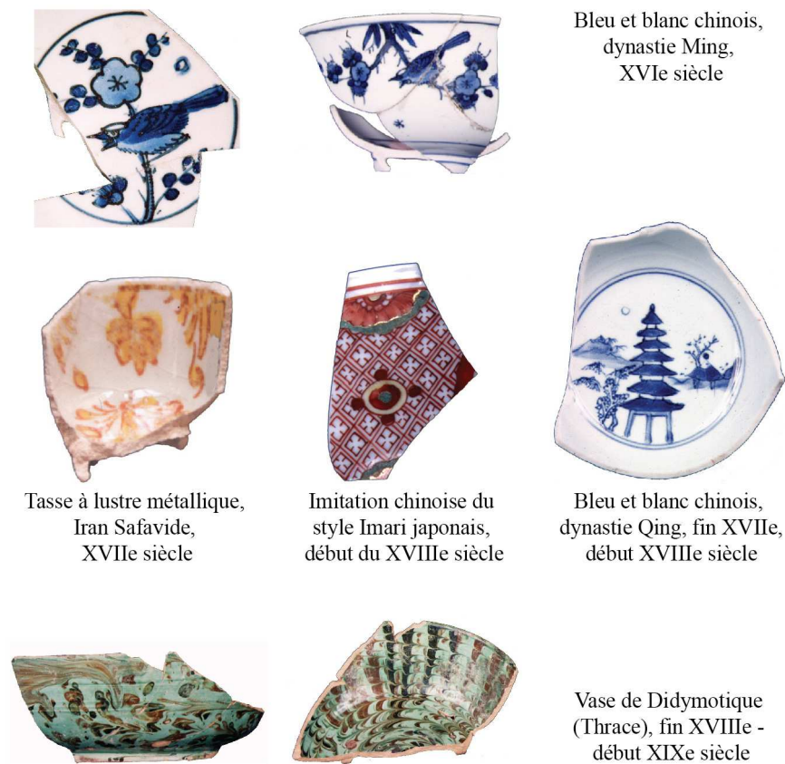
Figure 2. Exemples de céramiques retrouvées à Damas. La céramique tirée des fouilles de la citadelle de Damas témoigne de multiples échanges commerciaux entre Damas, l'Extrême-Orient et les autres régions de l'Empire au cours de la période ottomane. Extraits de V. François, Céramiques d'époques mamelouke et ottomane à la citadelle de Damas , à paraître.

constitue une opportunité d'échanges de marchandises entre l'ensemble des populations musulmanes. En outre, de riches négociants se joignent à la caravane et profitent de sa sécurité 6 . Ainsi, à l'aller comme au retour, à l'arrivée comme au départ, les voyageurs sont-ils lourdement chargés de marchandises dont une partie est négociée à Damas. Le volume des transactions commerciales réalisées à la faveur de cet événement - deux fois par an - est considérable. Bon an mal an, cette situation perdure jusqu'au début du XIX e siècle.