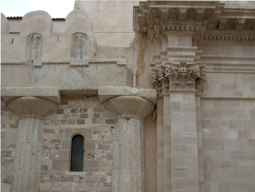
Figure 4. La cathédrale de Syracuse. La mise en exergue des multiples périodes de construction de l'édifice compose une figure figée qui ne laisse aucune place pour l'expression des périodes à venir (photo de l'auteur, nov. 2009).

mal renseigné ou qui ne souhaite pas lever toutes les ambiguïtés quant aux dispositions d'un édifice. Ensuite, les ambiguïtés peuvent être instrumentalisées au profit d'un point de vue ou d'une idéologie comme on l'a examiné dans l'exemple de la mosquée Sultan Hassan.