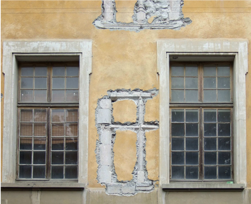
Figure 5. Les traces de la façade Renaissance de l'édifice, occultées par des transformations de la fin du XIXe siècle, sont révélées par les récents travaux de restauration. Cette intégration des multiples traces du temps passé par la période contemporaine ont pour effet d'exclure toute possibilité d'opérer la moindre transformation importante au cours des périodes à venir (Embrun, photo de l'auteur, mai 2007).

successifs d'un même lieu. On peut aussi envisager de figurer les transformations survenues entre deux dates et de rendre compte de cette manière de l'extension d'un ensemble de construction par exemple. Mais la mise en œuvre de ce principe trouve ses limites avec la nature des transformations. Il est effectivement difficile, voire impossible de représenter à travers une même figure des phénomènes qui, cumulés dans le temps, ont pour effet de s'annuler ; lorsqu'une construction est détruite puis remplacée par une autre suivant la même emprise, par exemple.