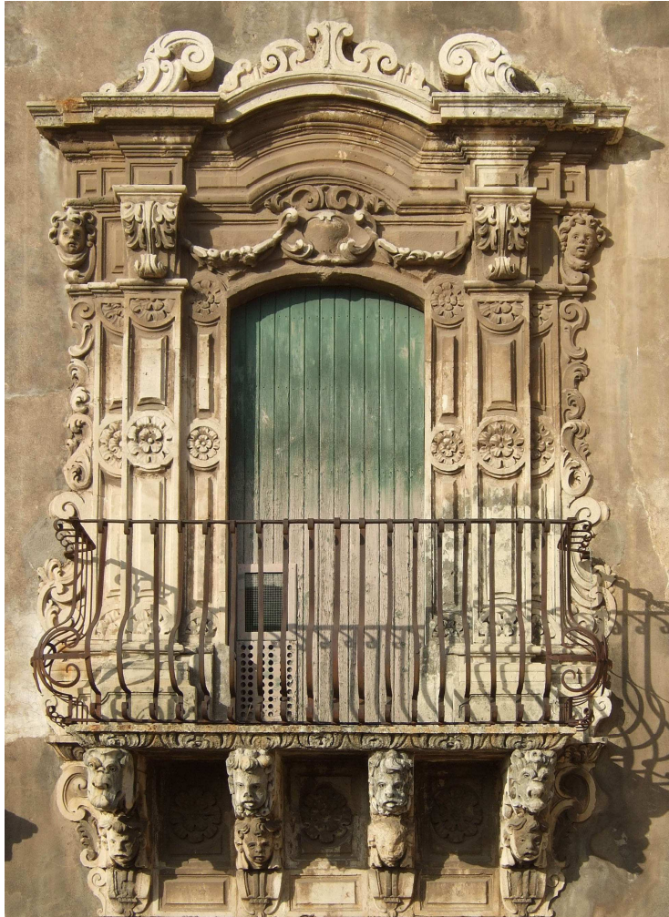
Figure 3. Fenêtre d'une façade de la faculté de Lettres de l'université de Catane. La surface occupée par les corbeaux du balcon, les pilastres, les moulures et le fronton est quatre fois supérieure à celle de l'ouverture proprement dite (photo de l'auteur, nov. 2009).

Entre les multiples traits de contour envisageables pour figurer une telle fenêtre, il n'y a pas de bon ou de mauvais choix mais seulement des expressions différentes. Chaque définition correspond à chaque auteur, au point de vue qu'il porte sur la composition de la façade et à la manière dont il souhaite en rendre compte en fonction de l'objectif qu'il assigne à la représentation. Ainsi, quelle que soit leur échelle, les figurations graphiques ne sont pas seulement partielles, elles sont aussi partiales.