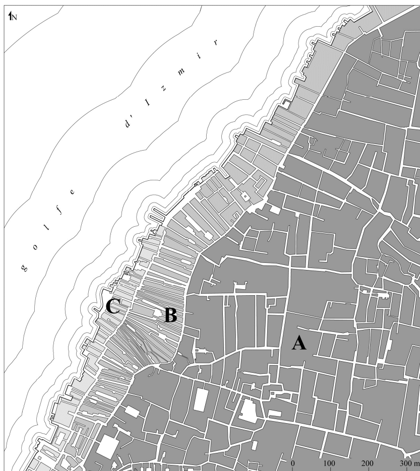
Figure 2. Extensions successives sur la mer. Izmir au milieu du XIXe siècle, d'après Luigi Storari, Pianta della Citta di Smirne (...), nell' anno 1854 e nell' anno 1856 , Paris, s.d., dessin de l'auteur

modélisable que l'analyse spatiale n'est pas une science exacte, les préoccupations du moment et la culture de chacun en détermine une part non négligeable 11 .