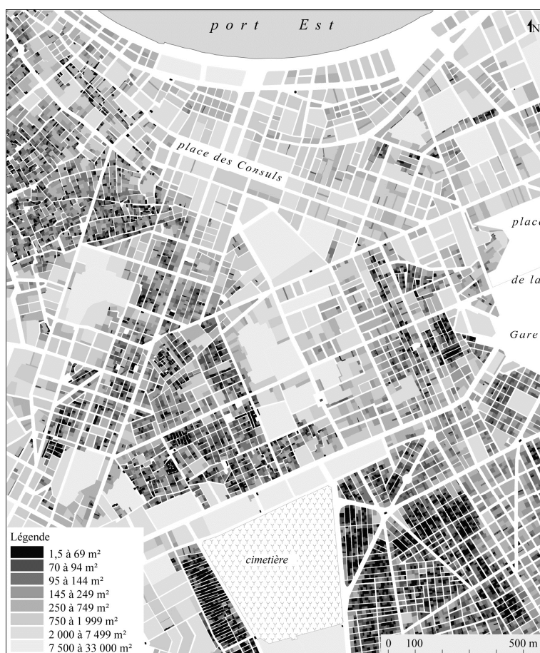
Figure 3. La cartographie assistée par ordinateur permet de travailler aux échelles les plus fines. Chaque unité de propriété est figurée en fonction de sa surface. Alexandrie vers 1935, d'après le plan cadastral, dessin de l'auteur

elle témoigne aussi d'une forte indifférence quant au statut des documents cartographiques. Trop souvent à mon sens ces documents sont réduits à un rôle illustratif mal défini ; il est symptomatique dans ce cas que le texte ne comporte aucun renvoi aux documents en question et que leurs légendes sont des plus laconiques 15 . Autrement dit, de nombreux auteurs seraient bien en peine d'expliquer pourquoi ils publient telle carte plutôt que telle autre. En outre, lorsqu'ils reçoivent peu de recommandations, les maquettistes ont parfois tendance à sélectionner les documents graphiques en fonction de leur qualité plastique, du format de la publication et des contraintes de la mise en page plutôt que pour leur relation avec le texte.