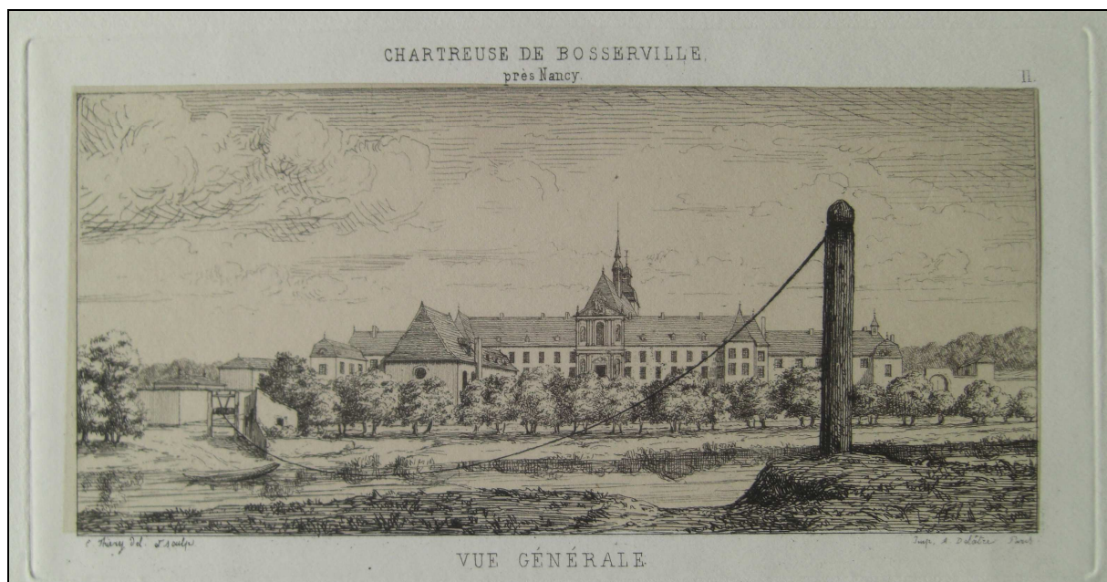
Document 4. « Chartreuse de Bosserville, près Nancy », gravure à l'eau forte de E. Thierry, 1861 (ci-dessous)