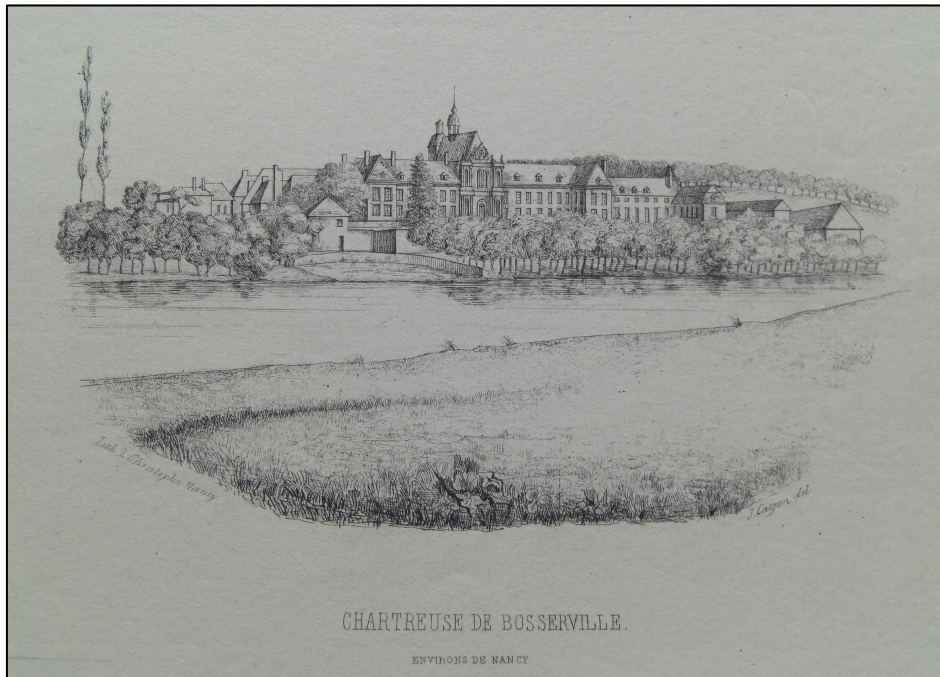
Document 3. « Chartreuse de Bosserville, aux environs de Nancy », gravure, sans date [vers 1860]. (à gauche)

Il témoigne ainsi de la persistance d'un stéréotype cartusien préexistant à toute lecture du paysage de Bosserville.