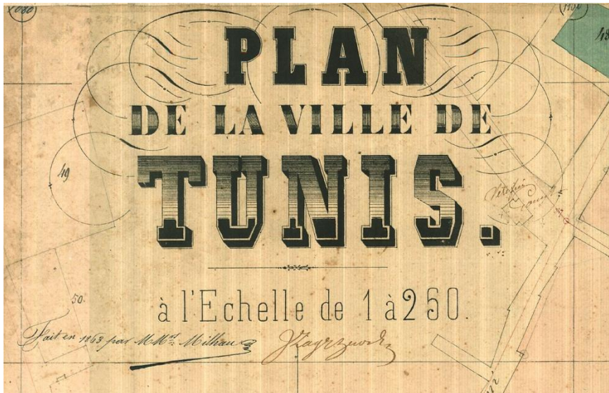
Figure 1 : Titre du plan de Milhau et Zagrzevski

Titre et signatures du plan ; ces indications recouvrent largement le champ de la représentation. Extrait d'une feuille représentant le quartier de Bâb Suwayqa.