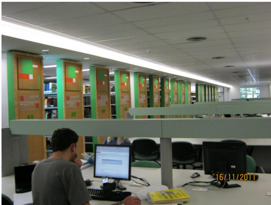
L'université PUCRS à Porto Alegre, bibliothèque.