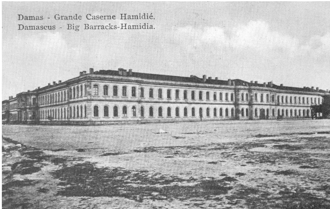
3. Damasco, caserma "Hamidiyé" costruita nel 1895 a circa un chilometro ad ovest della città. Dopo qualche decennio venne raggiunta e poi sorpassata dall'urbanizzazione

i grandi caffè, i ristoranti, i cinema... si moltiplicano per rispondere alle domande specifiche di questo nuovo gruppo sociale.