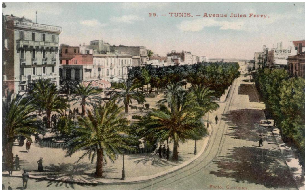
4. Tunisi, l' Avenue de la Marine intorno al 1910. Questa 'avenue', aperta nel corso degli anni Cinquanta dell'Ottocento, collega una porta dell'antica città con la riva della laguna.

Seguendo questo modo di produzione, la varietà e l'intrecciarsi che caratterizzavano il tessuto storico non hanno più corso: ciascuna lottizzazione si indirizza a una clientela scelta, molto omogenea. Mentre prima le differenze di mezzi tra gli acquirenti si esprimevano più attraverso la grandezza delle parcelle – le case dei ricchi erano più grandi di quelle dei poveri – che per la loro localizzazione, l'abbondanza dell'offerta del mercato fondiario, più forte della domanda, permette di sviluppare nuove strategie residenziali: la posizione dei terreni – in rapporto al centro, alle vie di comunicazione, alle attività... – costituisce un fattore determinante di scelta. In questo contesto, i gruppi sociali si organizzano nei nuovi quartieri in maniera ben più segregante che nel tessuto storico.