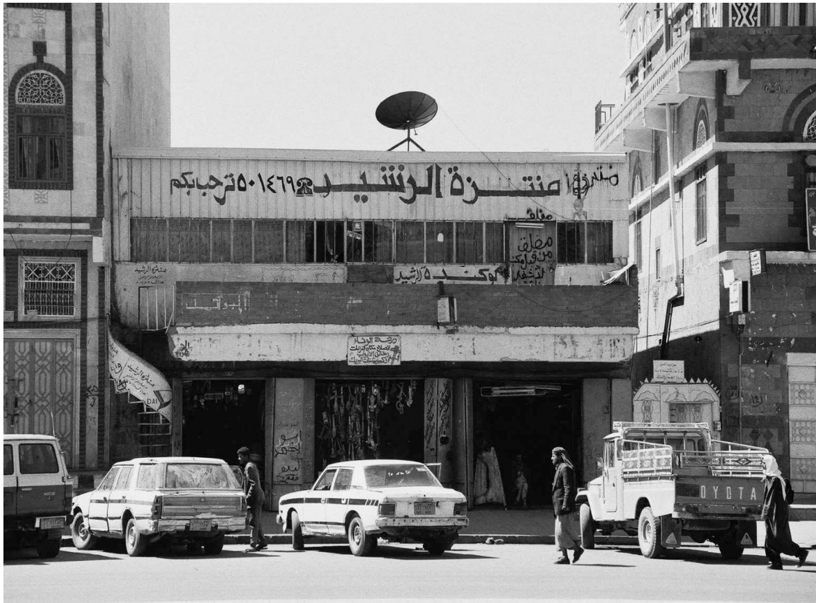
Photographie 2. Lukanda au sud de Sanaa : lieu d'accueil de migrants temporaires.