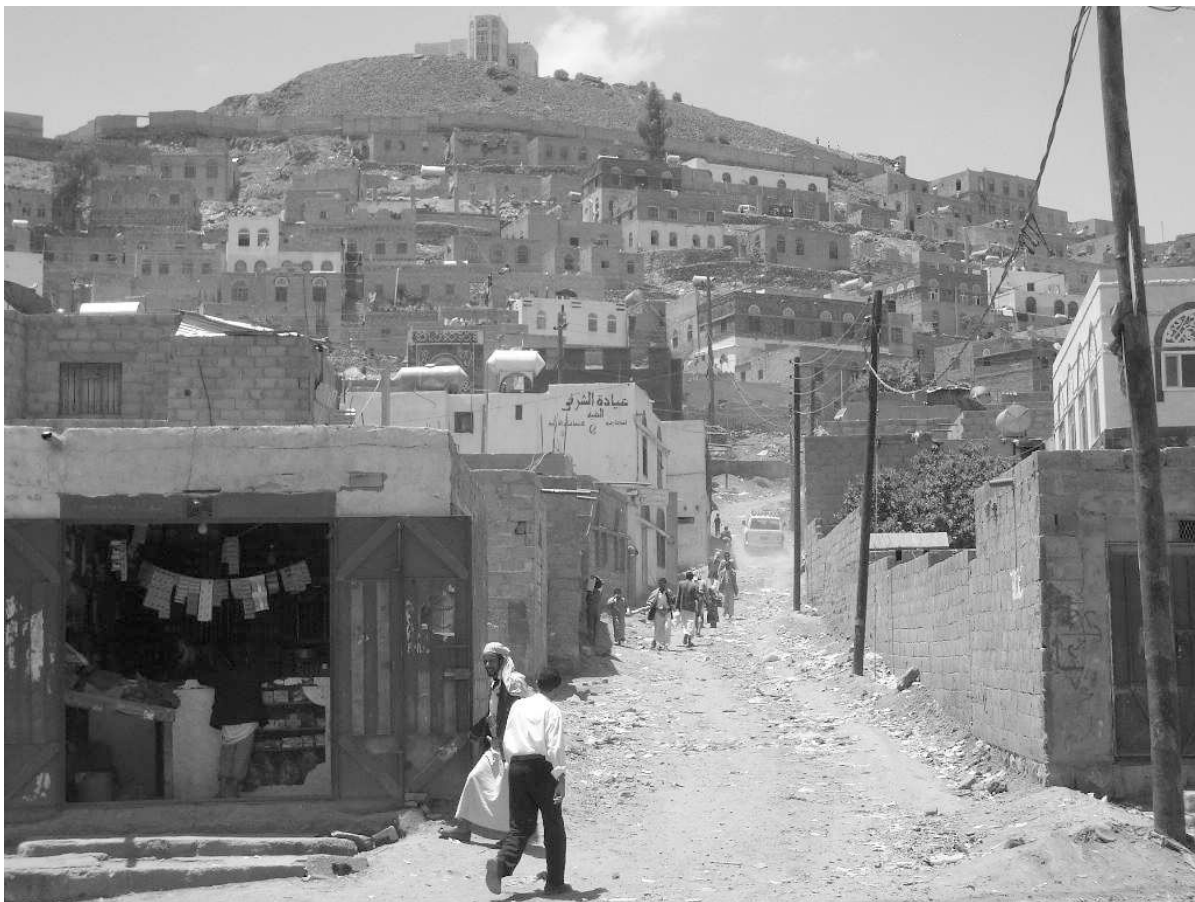
Photographie 1. Harat-al-Layl, quartier d'habitat irrégulier à l'ouest de Sanaa.

Néanmoins, la marginalité inhérente à la condition de migrant n'est pas toujours définitive et le cas de ces populations vouées à demeurer en marge de la société urbaine n'est pas généralisable. Aujourd'hui encore, environ 50 % de la population migrante du pays se dirige vers Sanaa. Les causes de ces migrations sont de plus en plus variées : de la nécessité économique à la poursuite d'études supérieures, en passant par les mutations de fonctionnaires. Ce sont les compétences et les ressources individuelles ou les structures d'accueil dont ils disposent qui, nous le verrons, permettent, ou non, aux migrants nouvellement débarqués de s'intégrer à la société sanaanie.