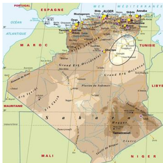
Fig. n°1 : situation de la ville d'Ouargla

Ouargla se trouve à la lisière occidentale de l'Erg Oriental et à 575 km au sud des rivages de la Méditerranée. Parmi les rares îlots qui, à travers le Sahara, ont pu devenir taches de verdure (oasis de 1500 hectares) et centres de vie humaine, Ouargla apparait comme la récompense promise aux termes des longues marches sahariennes. Positionnée au centre des pistes commerçantes sahariennes 16 , l'arrivée des Ibadites et la création de Sedrata avec l'épanouissement du commerce, on fait qu'Ouarglaa pu prospérer. Le ksar 17 est érigé au X ème siècle, sur un plateau,