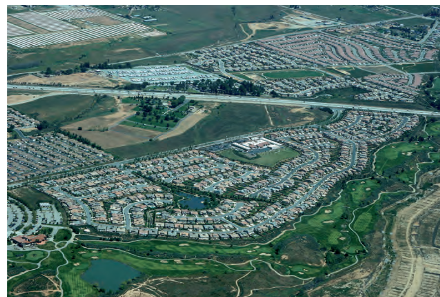
Fig. 1. Un lotissement planifié en cours de construction, à Cherry Valley, comté de Riverside, 2010

En Californie du Sud, ces marges urbaines de la dernière phase sont peu commodes à appréhender (Fig. 1). En dépit des apparences de continuité, elles correspondent à des processus radicalement nouveaux d'organisation. Ceci tient aux évolutions profondes de la gouvernance locale et