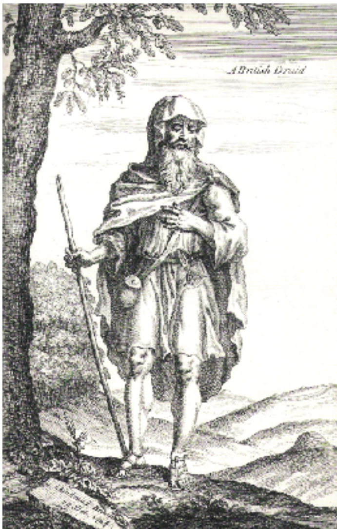
Le druide dans une vision romantique. D'après W. Stukeley, Stonehenge, A Temple Restor'd to the British Druids , 1740.

Les théoriciens du comparatisme, dans le même temps, faisaient des Celtes une branche, parmi les plus anciennes, des mythiques Indo-Européens. Les historiens nazis virent en eux des compagnons acceptables de leurs ancêtres germains. C'est pourquoi, après le deuxième conflit mondial, les Celtes vinrent quasi naturellement remplacer ces derniers dans le discours des archéologues. Mais ces Celtes, refaçonnés par les idéologies les plus discutables, sont-ils vraiment fréquentables ? Ne faudrait-il pas revenir à une réalité historique, moins merveilleuse mais plus humaine que le mythe ?