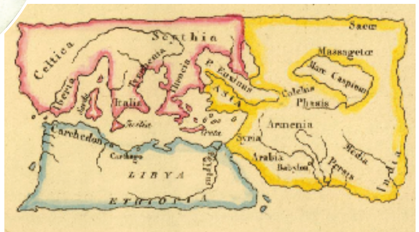
Géographie du monde selon Éphore. D'après C. Malte-Brun, Géographie primitive des Grecs , II, 1831.

À quoi correspondait le nom indigène de Celtas qu'ils s'étaient eux-mêmes donné? Il ne pouvait s'agir d'une revendication ethnique, puisque la population la plus ancienne à l'avoir porté, celle de l'arrière-pays méditerranéen, était composée de groupes hétérogènes : autochtones, Ligures, Ibères et commerçants étrangers qui s'y étaient