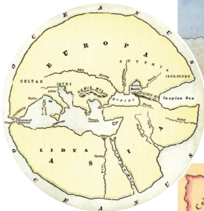
Mappemonde selon Hécatée de Milet, gravure du XIX e siècle.

enquête. Il divisait le pays en trois grands ensembles : les Celtas, de la Loire à la Méditerranée; les Belgas, au nord de la Seine; les Aquitani, au sud de la Garonne, découpage que l'on retrouve dans les textes de César et de Strabon. Pour tous ces auteurs, et notamment pour ceux qui avaient visité la Gaule, il ne faisait aucun doute que les Celtes étaient un ensemble de groupes humains occupant la vaste région dont le Massif central marque le centre.