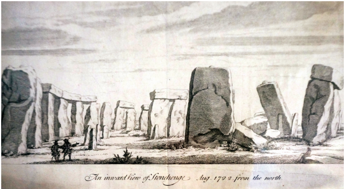
Illustration de William Stukeley, qui le premier associe mégalithes et Celtes. D'après W. Stukeley, Stonehenge, A Temple Restor'd to the British Druids , 1740.

installés (Étrusques et Grecs). Il faut plutôt y voir, comme le laisse entendre Tite-Live, une forme de confédération, créée en réponse au commerce grec qui demandait aux Gaulois d'importantes quantités de matières premières d'origine lointaine. Il leur avait donc fallu s'entendre pour organiser le transport et les échanges. Des accords commerciaux on était passé aux traités diplomatiques puis aux alliances politiques. Les Celtes avaient profité du contact avec les Grecs, et les Massaliotes plus particulièrement : leur civilisation s'était affermie ; à leur tour ils la diffusèrent à leurs voisins qu'ils appelaient Galatas , nos Gaulois.