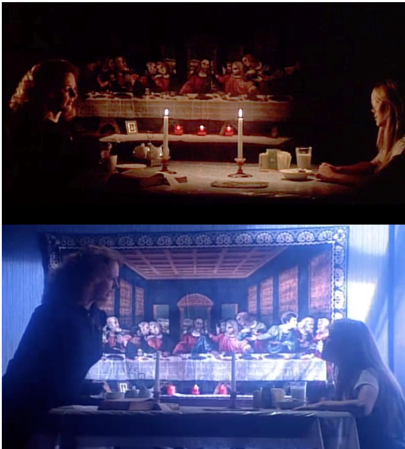
Figure 5 extraite de Carrie/Carrie au bal du diable de Brian De PALMA (United Artists, E.-U., 1976).