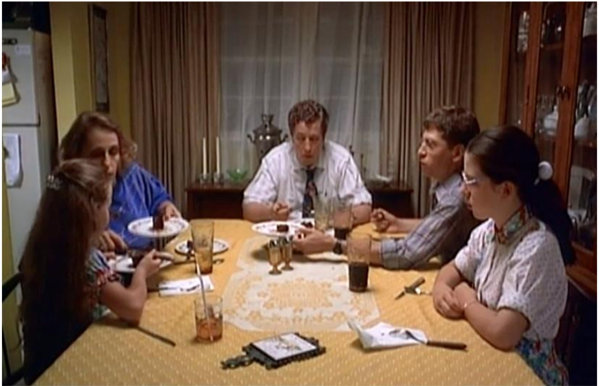
Figure 6 extraite de Welcome to the Dollhouse/Bienvenue dans l'âge ingrat de Todd SOLONDZ (Suburban Pictures/Sony, E.-U., 1995). Reproduit avec autorisation.

En bout de celle-ci se trouve le patriarche, la disposition définit très clairement une hiérarchie de sexe et d'âge. La table sert de médium qui établit l'immuable ordre social (ou la formation sociale) de l'unité familiale par le plan de table et littéralement par les ordres donnés. Le sens de circulation du pouvoir est unidirectionnel, du sommet vers la base.