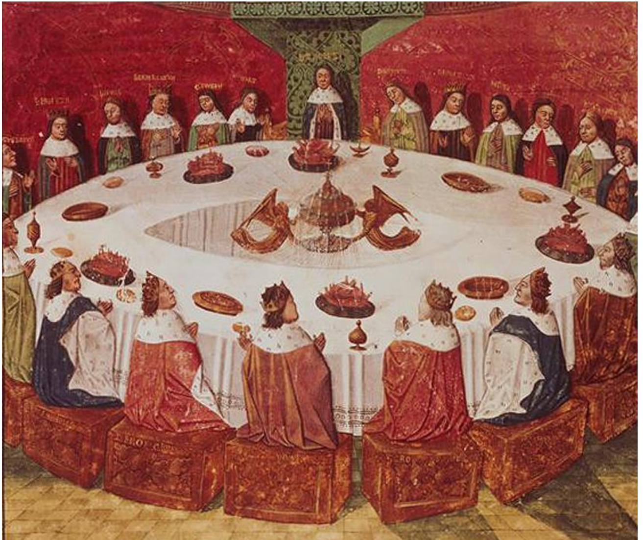
Figure 2 : Auteur Anonyme : Les chevaliers de la Table Ronde. Cote cliché: 01-015060, Fonds: Miniatures et enluminures, Période : 13e siècle, Bas Moyen Âge (Europe occidentale), Technique/Matière : peinture sur papier, Localisation : Paris, Bibliothèque nationale de France (BnF). Reproduit avec autorisation.

Ce n'est pas par hasard que la table semble être, dans de très nombreux cas, représentative de ce à quoi chacun peut se sentir lié précisément parce qu'il s'agit d'un objet familier : la table est un objet que chacun ou presque chacun peut facilement se représenter ou peut-être même possède. Dans La République , Platon se sert déjà de la table comme cas type pour expliquer la relation de l'objet à l'idée, d'un objet matériel à la nature de cet objet :