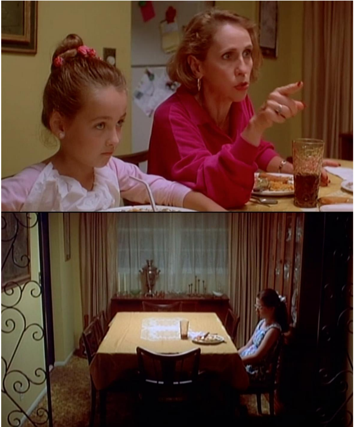
Figure 7 extraite de Welcome to the Dollhouse/Bienvenue dans l'âge ingrat de Todd SOLONDZ (Suburban Pictures/Sony, E.-U., 1995). Reproduit avec autorisation.

Bienvenue dans l'âge ingrat est un autre exemple dans lequel une scène autour d'une table à manger familiale définit la dynamique des relations au sein de la famille et des