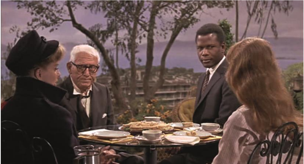
Figure 3 extraite de Guess Who's Coming to Dinner?/Devine qui vient dîner ? de Stanley KRAMER (Columbia Pictures, E.-U., 1967). Reproduit avec autorisation.

Guess Who's Coming For Dinner? 593 (1967, cf fig.3), fut porteur pour Sidney Poitiers, la plus grande (voire même la seule) star afro-américaine de l'époque.