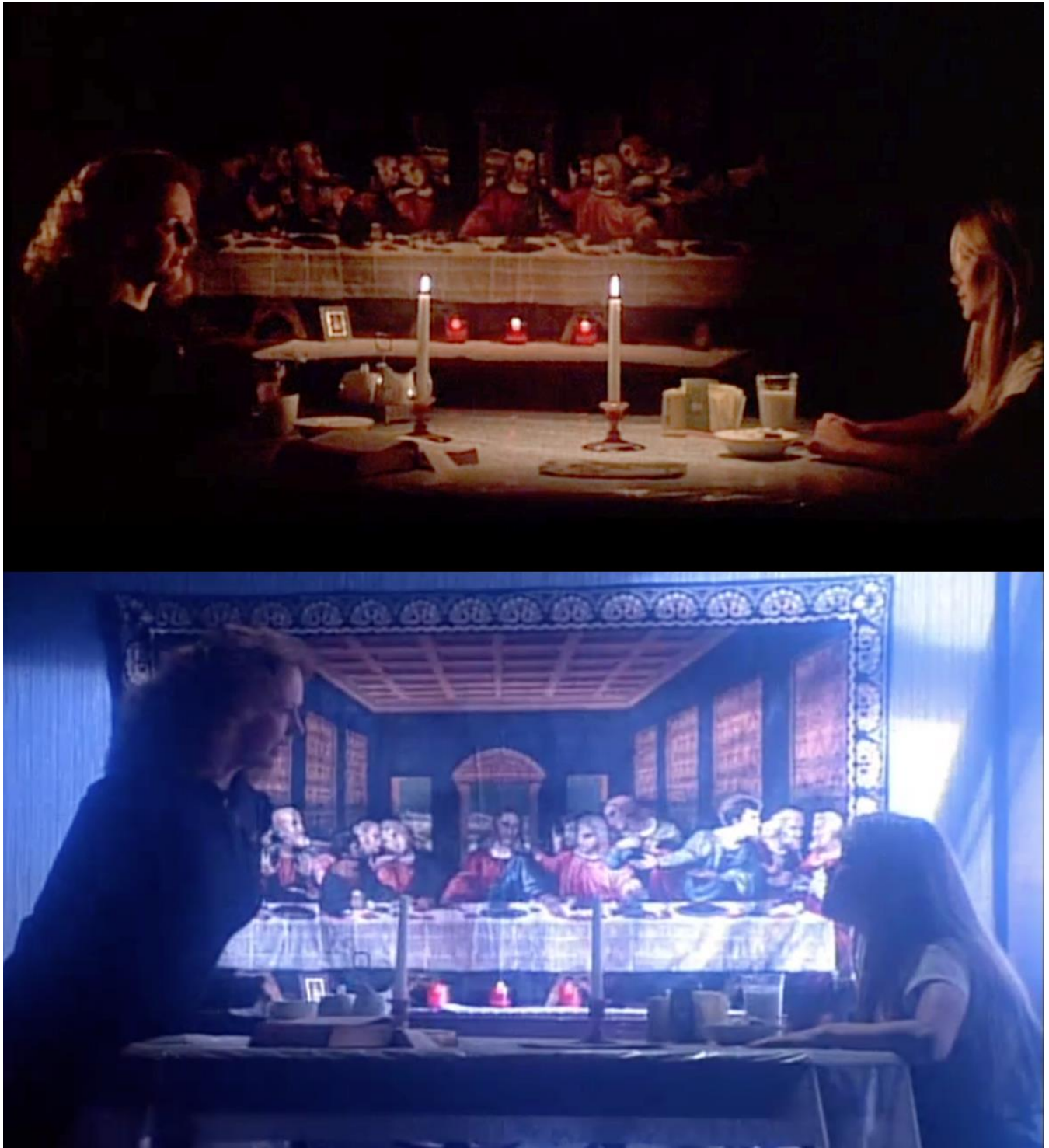
Figure 5 extraite de Carrie/Carrie au bal du diable de Brian De PALMA (United Artists, E.-U., 1976).