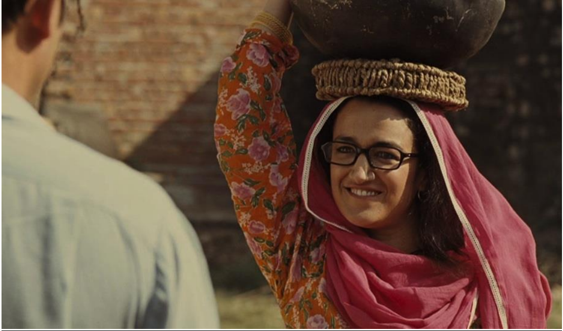
Figure 2 : West is West

Légende : Neelam (Zita Sattar) est l'épouse parfaite pour Maneer ( West is West , Andy De Emmony, 2010)