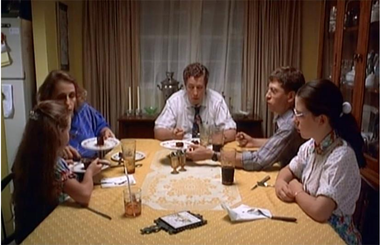
Figure 6 extraite de Welcome to the Dollhouse/Bienvenue dans l'âge ingrat de Todd SOLONDZ (Suburban Pictures/Sony, E.-U., 1995). Reproduit avec autorisation.

En bout de celle-ci se trouve le patriarche, la disposition définit très clairement une hiérarchie de sexe et d'âge. La table sert de médium qui établit l'immuable ordre social (ou la formation sociale) de l'unité familiale par le plan de table et littéralement par les ordres donnés. Le sens de circulation du pouvoir est unidirectionnel, du sommet vers la base.