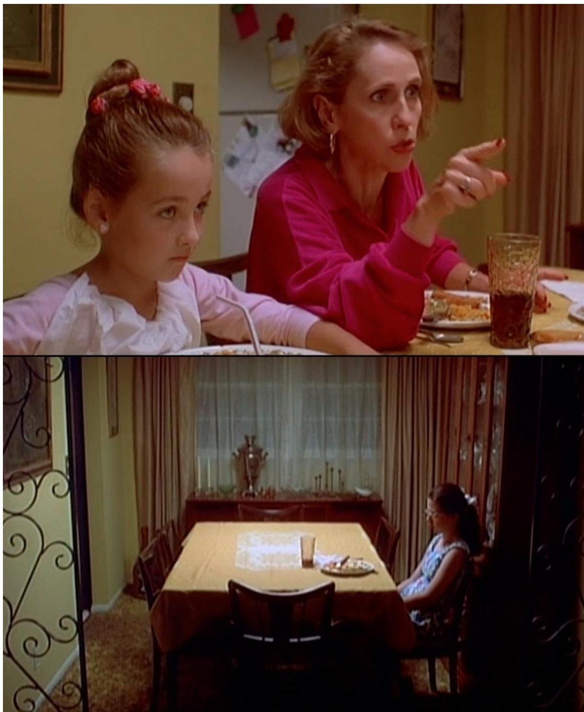
Figure 7 extraite de Welcome to the Dollhouse/Bienvenue dans l'âge ingrat de Todd SOLONDZ (Suburban Pictures/Sony, E.-U., 1995). Reproduit avec autorisation.

Bienvenue dans l'âge ingrat est un autre exemple dans lequel une scène autour d'une table à manger familiale définit la dynamique des relations au sein de la famille et des