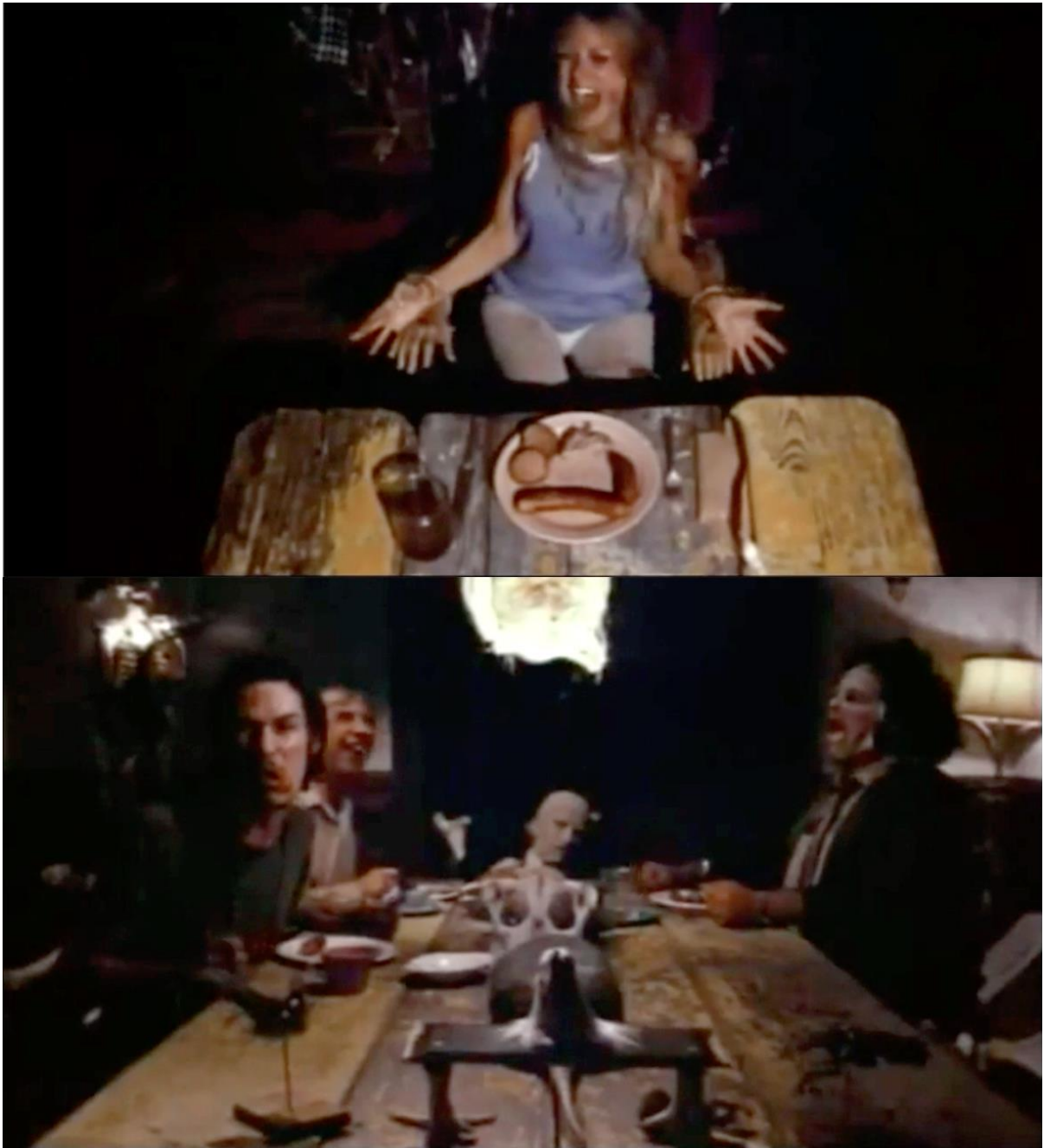
Figure 4 extraite de The Texas Chainsaw Massacre/Massacre à la tronçonneuse de Tobe HOOPER (Vortex/Bryanston Pictures, E.-U., 1974). Reproduit avec autorisation.

Comme dans La Cène , c'est la scène de repas qui a le pouvoir de dévoiler le caractère de ses participants et de révéler les dynamiques des liens relationnels, les hiérarchies, l'idéologie ou les conflits : aussi dérangés soient-ils, les Sawyers (la famille de Leatherface ) se comportent à leur manière comme une famille normale. Ainsi Leatherface tient le rôle de la mère qui, le tablier autour de la taille, sert la nourriture, le vieux patriarce siège en bout de table, cependant leur comportement à table, leur façon