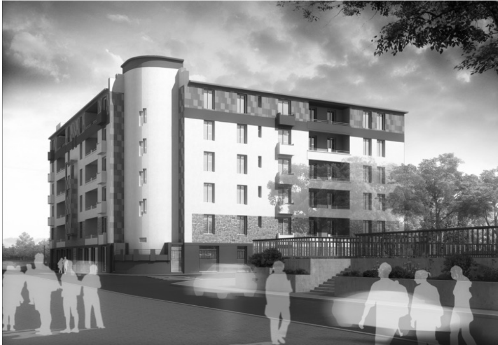
Ill. 1 : Projet de logement, concours du quartier Zuccarelli, Montpellier. Architecte : Patrice Genet