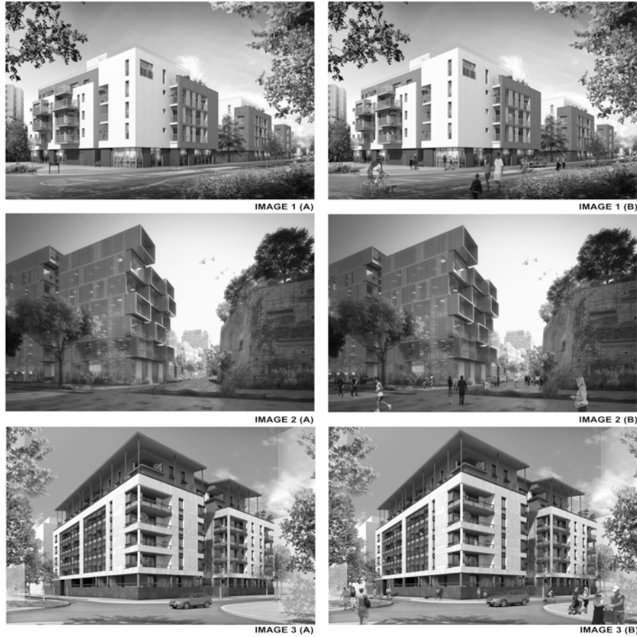
Ill. 3 : Images d'ambiance urbaine idéale utilisées pour les enquêtes de perception. À gauche, groupe d'images sans personnages (A), à droite, groupe d'images avec personnages (B) (18).