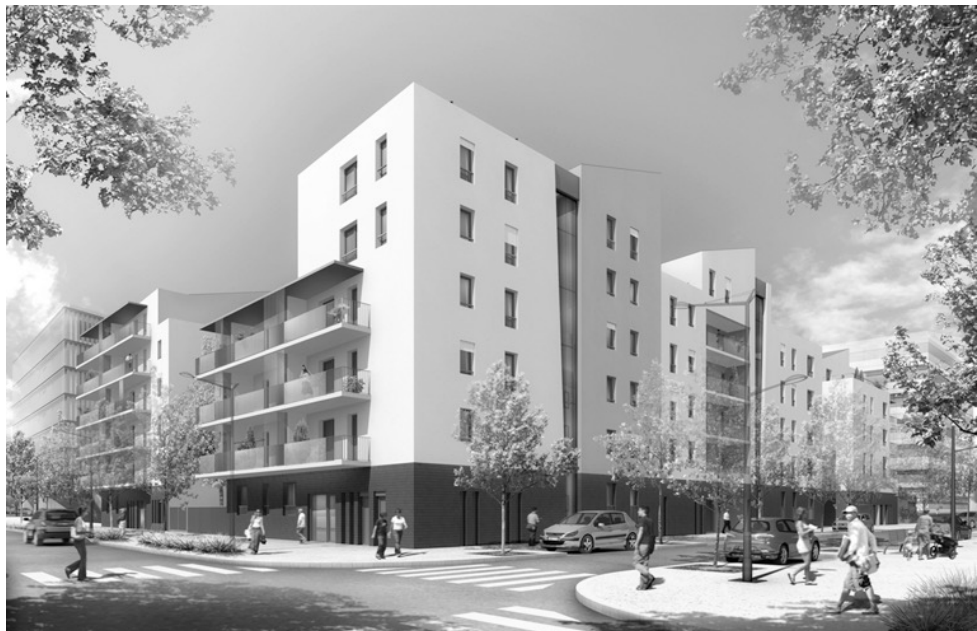
Ill. 2 : Projet Carré de soie, îlot Touly, Vaulx-en-Velin. Architecte : SOHO Architecture et Urbanisme ( http://www.thierrybaille.com/architecture/image-de-synthese_logement.html )