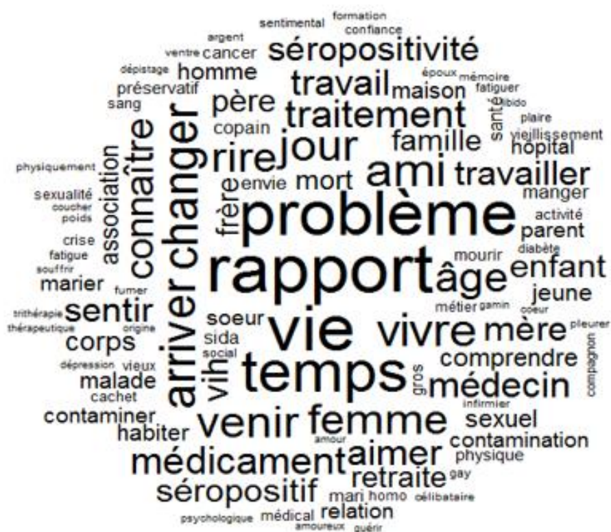
Figure 1. Nuage de mots réalisé à partir des 45 entretiens

Nous avons ainsi réalisé un nuage de mots (figure 1) nous permettant au préalable d'observer les formes lexicales les plus utilisées du corpus :