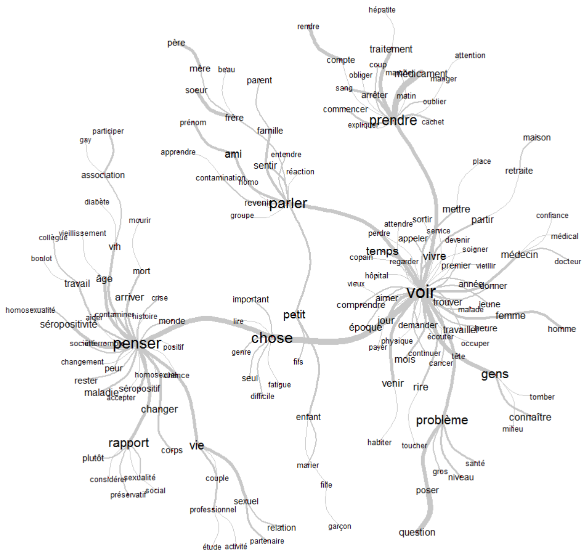
Figure 2. ADS du corpus entier