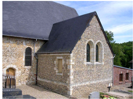
Croisillon sud du XIII e siècle

La nef semble avoir été reprise dans son ensemble au XV e siècle avec le rehaussement des murs, la reconstruction complète de la première travée et du mur sud sur toute sa longueur. Toutes les baies correspondent à ces travaux. Le clocher et le beffroi qu'il contient appartiennent à cette campagne de construction liée probablement à la reprise économique de l'après guerre de Cent Ans, dans la seconde moitié du XV e siècle. Une plaque commémorative en pierre calcaire située dans le chœur mais non en place, portant la date de 1484, évoque la dédicace de l'église en présence de l'évêque d'Ipône, suffragant de l'archevêque de Rouen. Cette inscription confirme donc un grand chantier de reconstruction de l'église à l'issue de laquelle elle fut de nouveau dédiée sous l'autorité d'un représentant de l'archevêché. Il est fort probable que ce chantier concerne la reconstruction de la nef, du beffroi et du clocher qui, comme on le verra plus loin sont médiévaux, la charpente du croisillon sud, probablement aussi le chœur, reconstruit au XVIII e siècle, et vraisemblablement la charpente de la nef, refaite au XVI e siècle (voir plus loin).