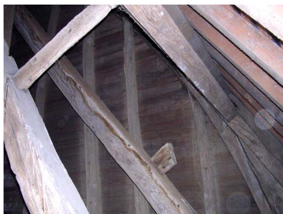
Arbalétrier du clocher avec échantignole conservée en place de l'ancienne toiture du XV e siècle.

Le clocher et le beffroi, situé en partie haute, apparaissent avec évidence comme une structure du XV e siècle, antérieure à la charpente voûtée de la nef. Cette charpente particulièrement complexe présente en elle-même deux fermes destinées originellement à porter les pannes de l'ancienne toiture, de pente inférieure à l'actuelle et dont les échantignoles (cales fixées sur les arbalétriers destinées à supporter les pannes) sont encore présentes. Avec cette toiture primitive, plus basse que celle mise en place un siècle plus tard avec la voûte lambrissée, le clocher montrait un étage extérieur supplémentaire, aujourd'hui situé sous le toit, et dont les bois sont encore recouverts des clous de son voligeage d'origine. Cet étage était composé d'un niveau de croix de Saint André assemblées à un cours inférieur et supérieur de liernes. Lors de sa construction, ce clocher paraissait donc encore plus haut qu'il ne l'est aujourd'hui.