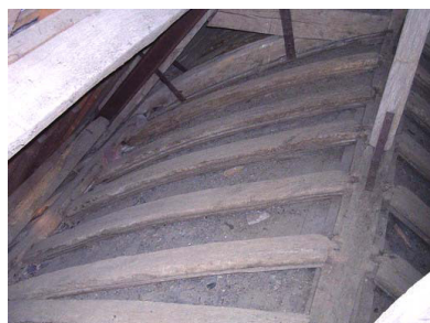
Série de 7 cerces courbes

La structure de la voûte d'origine est toujours en place derrière le lambris en sapin. Elle est constituée d'une ossature longitudinale de liernes assemblées par tenon-mortaise aux flancs des arbalétriers, complétée par le cours des sous-faîtières, et d'une série de cerces courbes (11 x 7 cm), disposées dans le plan vertical, longues de 2 m environ et espacées régulièrement de 27 cm. Les liernes délimitent donc trois panneaux par travée et par versant, dans lesquels s'insèrent sept cerces d'égales longueurs. Ces cerces sont assemblées par tenon-mortaise dans les liernes et en tête dans la sous-faîtière par un curieux petit tenon inséré verticalement dans un ressaut mortaisé, taillé dans l'épaisseur du bois. La face inférieure (intradós) de ces cerces est finement moulurée et le lambris rajouté au XIXe siècle ne les a pas altéré, les planchettes ayant été simplement clouées en sous-face, sans buchage des moulures.