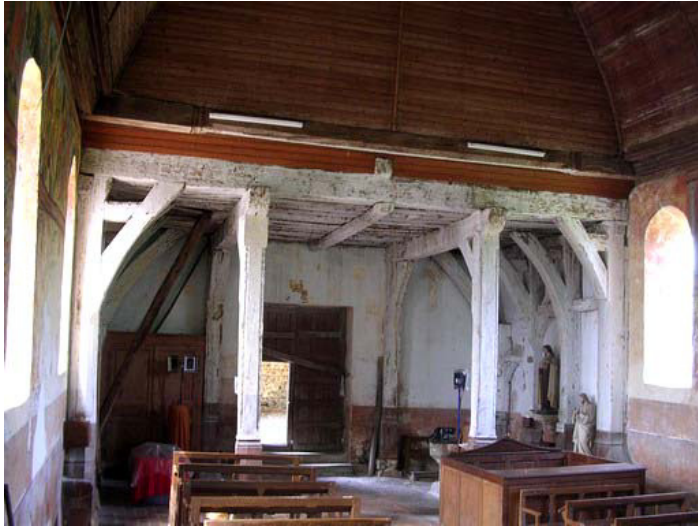
Portique du clocher, fin XVe siècle

poteaux et garantit sommairement une éventuelle banquette aux paroissiens. Cette sablière a malheureusement beaucoup souffert des remontées d'humidité par le sol, liées à la déclivité du terrain qui amène l'eau de ruissellement du coteau au pied des murs. L'affaiblissement de cette poutre a entraîné un affaissement des poteaux et la sortie de quelques centimètres des assemblages des croisillons.