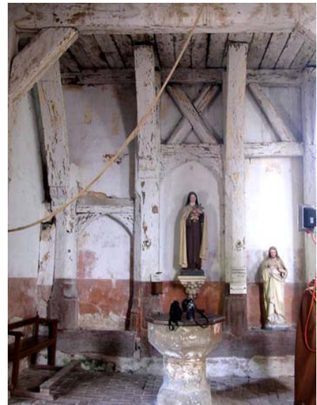
Poteaux nord du portique

Des sculptures très délicates de style gothique sont taillées aux arêtes de ces poteaux et représentent des motifs architecturaux (pinacles, colonnes torsadées) et des personnages placés dans des niches. Ces motifs sont typiques de la sculpture sur bois de la fin du Moyen Age et se retrouvent fréquemment sur les façades des maisons en pans de bois du XVe siècle. Ces motifs disparaissent au XVIe siècle avec l'arrivée de la Renaissance et de ses modèles iconographiques antiquisants.