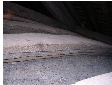
Rainure creusée dans le flanc des cerces pour l'insertion du lambris, avec les moulures en sous-face

Si l'ensemble des liernes et des cerces est toujours en place, le lambris d'origine a quant à lui totalement disparu. Il était composé de planches longues de 2 m et larges de 30 cm, qui étaient insérées dans des étroites rainures de 7 mm creusées sur les flancs des cerces. Ces planchettes devaient être cependant relativement épaisses, seuls leurs bords étaient bisautés pour pouvoir s'insérer dans les rainures des cerces. Il n'a pas été possible de voir si des traces de peinture pouvaient subsister en sous-face des cerces.