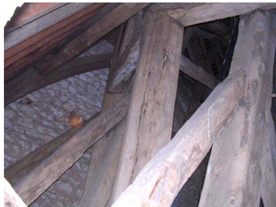
Vue des pièces obliques pénétrant à travers la charpente de la tour du clocher

Cette intelligence technique n'a cependant pas été perçue par des restaurateurs au début du XXe siècle qui ont rajouté des ferrures de consolidation un peu partout dans cette charpente et notamment au niveau du beffroi qui se trouve désormais solidarisé à la charpente du clocher par des liens métalliques qui devraient un jour être retirés pour retrouver cette indépendance entre ces deux structures.