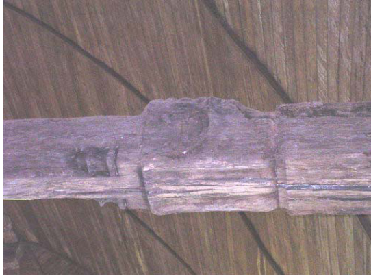
Engoulant des entrails