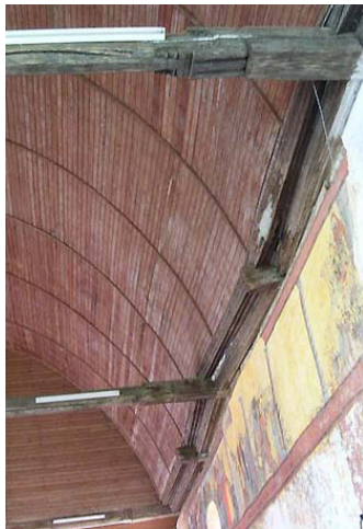
Poussées latérales des fermes dépourvues d'entrait

La rupture des étrésillons qui assuraient le lien entre les sablières interne et externe (voir photos) a accéléré le dévers de cette dernière sous la poussée des chevrons. Cette rupture est consécutive de la mauvaise conception de ces sablières, typiques pour l'époque, qui ne peuvent correctement répondre aux poussées du chevronnage. Ces poussées latérales, particulièrement fortes du fait de l'inclinaison à 60° des chevrons, ont entraîné des déformations importantes au droit des fermes dépourvues de tirant à leur base. L'ouverture de ces fermes a provoqué la rupture de certains assemblages en partie haute, notamment en pied des aisseliers aux arbalétriers. Par ailleurs, la suppression du lambris au XIXe siècle a libéré la voûte de son système de raidissement et a provoqué son dévers. La faiblesse du contreventement de cette charpente (deux liens faiblement inclinés entre le faîtage et le sous-faîtage), privée du lambris, combinée aux poussées latérales, au dévers des sablières et à la rupture de certains assemblages des fermes a eut pour conséquence le déversement vers l'Est de l'ensemble de la charpente. Toutes les fermes sont aujourd'hui fortement inclinées avec un débord de 1 mètre entre l'axe vertical passant à la base d'une ferme et le pied de son poignon haut (sommet de la voûte).