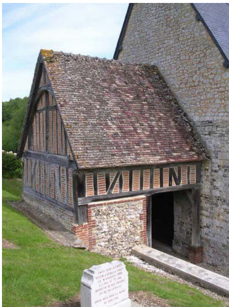
Porche fin XVe-début XVIe siècle avec sa charpente voûtée non lambrissée pourvue de cerces courbes

Pour conclure, il faut noter l'élégant porche en pans de bois qui présente une charpente de comble voûtée non lambrissée et dont la structure est presque identique à celle de la voûte de la nef avec une série de cerces courbes assemblées à des liernes et à une sous-faîtière. L'entrait de la ferme médiane est dépourvu de poinçon. En pignon, une ferme débordante (ou gable) avec aisseliers courbes évoque le voûtement intérieur selon une structure différente. Cette fantaisie est typique des façades des maisons médiévales en pans de bois à pignon sur rue et dont l'intérêt était de protéger le colombage du ruissellement des eaux de pluie. Des moulures sont présentes sur les sablières et aux extrémités de l'entrait. Les motifs géométriques en fûts torsadés sont caractéristiques de la fin du XVe-début du XVIe siècle et permettent d'attribuer cette construction à la campagne de la nef. La porte sculptée que ce porche abrite semble contemporaine de l'édification de ce porche.