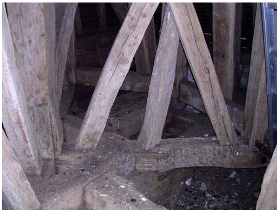
Enrayure de base aux poteaux de la tour du clocher

La charpente du clocher se compose d'une tour octogonale qui supporte un étage à claire voie (chambre des cloches) où se situe le beffroi et d'une haute flèche extrêmement pentue, l'ensemble étant articulé autour d'un mat central. Les huit poteaux de cette tour sont assis sur une enrayure en étoile qui est directement posé sur le portique sous-jacent. L'ingéniosité de cet ouvrage s'observe au niveau du beffroi qui est complètement désolidarisé de la structure du clocher, pour des raisons statiques liées au branle des cloches. On constate en effet que le beffroi s'appuie sur un plancher qui est soutenu par 4 longues et puissantes pièces obliques, étayées à plusieurs niveaux et assemblées en pied dans les sommiers du portique. Ces pièces obliques assurent le raidissement de la chambre des cloches, en récupérant les vibrations du beffroi et en assurant ainsi la stabilité de la charpente du clocher. C'est une prouesse technique d'avoir su garantir une telle sécurité statique d'un beffroi niché en partie haute d'un clocher, au-dessus du faîtage du toit. Le beffroi fonctionne indépendamment de la structure du clocher.