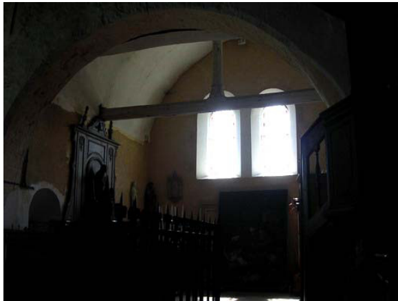
Croisillon sud, murs et baies du XIIIe siècle, charpente du XVe siècle et ouverture en plein cintre du XVIe siècle

Autre structure appartenant à la campagne de reconstruction de l'église de la fin du XVe siècle : la charpente du croisillon sud, dont les murs sont du XIIIe siècle. Il s'agit d'une charpente voûtée comprenant une ferme médiane à entrait et poinçon sculpté. Ce dernier comporte un chapiteau et une base moulurée. Une lierne longitudinale moulurée aux arêtes inférieures doit recevoir les cerces de la voûte, dissimulées par un plâtre récent. L'extrados de la voûte n'est pas accessible par les combles et il n'a donc pas été possible d'observer la structure de cette voûte. La forte section des bois ainsi que les moulures suggèrent une datation du XVe siècle.