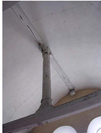
Ferme médiane avec son poinçon sculpté

La charpente voûtée de la nef est une construction du XVIe siècle, plus tardive que le clocher. Elle remplace une charpente plus ancienne qui était moins haute et pentue que celle-ci et dont le témoignage subsiste sur des arbalétriers présents dans le clocher.