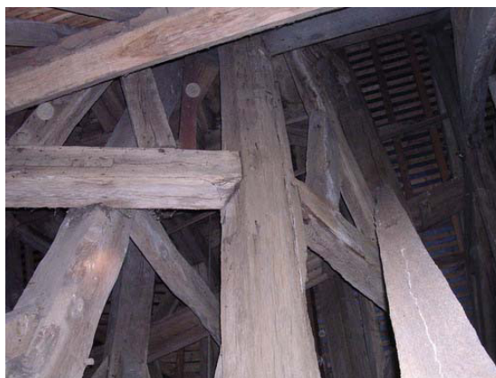
Etage du beffroi primitivement extérieur, couvert de clous du voligeage de sa couverture d'origine.

La charpente de ce clocher du XV e siècle est d'une qualité technique et esthétique exceptionnelle et témoigne d'un très haut niveau de compétence de la part du maître charpentier. Situé dans la 1 ère travée de la nef, le clocher repose sur un puissant portique composé quatre sommiers transversaux soulagés aux extrémités par des poteaux et des aisseliers ainsi que par deux portiques longitudinaux médians. Ces sommiers se prolongent en partie dans les maçonneries pour renforcer leur appui. Entre les poteaux de ce portique, des arcatures et des croisillons agrémentent les côtés en définissant des alvéoles de différentes hauteurs. Une grosse sablière continue sert d'assise à ces