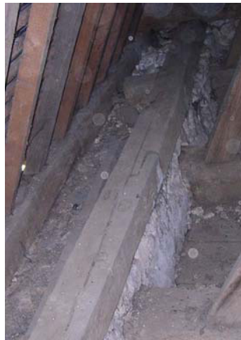
Dévers des sablières externes suite à la rupture des étrésillons