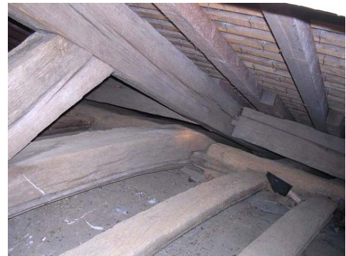
Rupture de l'assemblage du pied de l'aiselier à l'arbalétrier suite à l'ouverture de la ferme

Suite à toutes ces déformations, des équerres métalliques ont été disposées sur la plupart des assemblages de la charpente, probablement au début du XXe siècle, stabilisant pour le moyen terme l'ensemble de la structure.