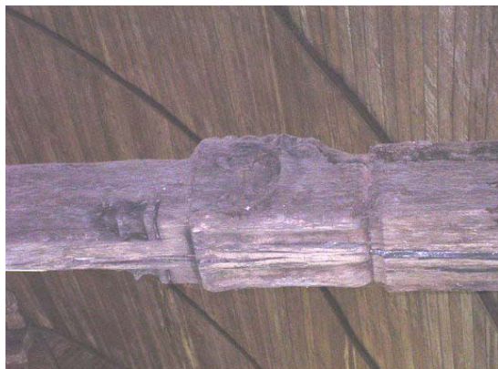
Engoulant des entrails