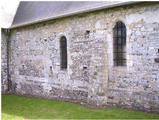
Maçonneries du XIII e siècle du mur nord la nef

L'église Saint Martin de Bézu-la-forêt est un édifice complexe composé de plusieurs parties d'époques distinctes, comprises entre le XIII e siècle et le XVIII e siècle. On constate en effet que la 2 ème et 3 ème travée du mur nord de la nef présentent des parties de maçonneries du XIII e siècle limitées aux deux tiers de la hauteur du mur avec une corniche primitive encore en place, située sous le rehaussement plus tardif du mur. Le croisillon sud apparaît aussi comme une construction du XIII e siècle avec ses deux baies jumelées axiales et un appareillage en blocage de silex, typiques de cette époque, encore bien visibles malgré les récentes restaurations.