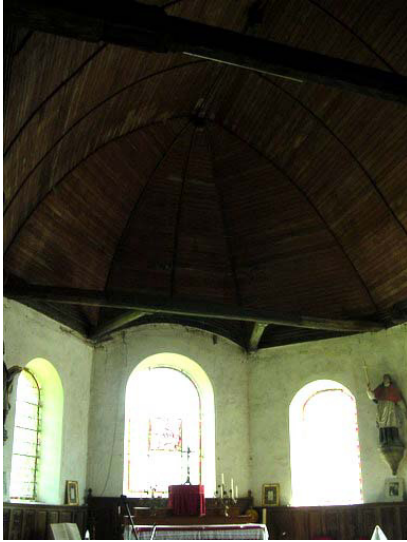
Abside à trois pans du chœur