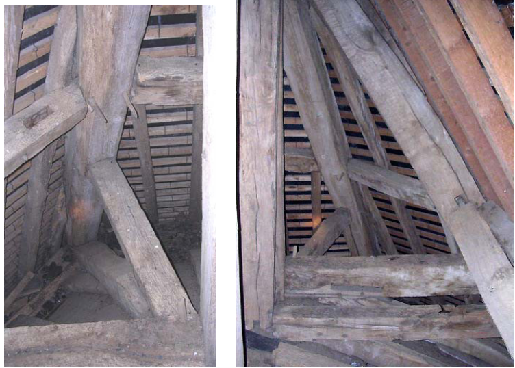
Vues des demi-fermes d'arçêtres de l'abside