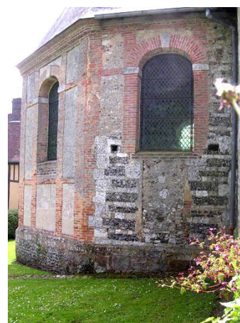
Chevet moderne reprenant en partie des murs médiévaux

Le chœur apparaît dans son ensemble comme une construction du XVIII e siècle. Il remplace l'ancien chevet du XV e siècle dont subsistent au nord quelques maçonneries définies par une alternance de lits calcaire et de silex, avec des vestiges d'une baie murée.