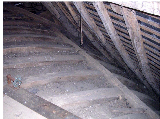
Lierne et cerces de la voûte

Le lambris d'origine, aujourd'hui disparu et remplacé par un lattis recouvert d'un enduit plâtré, devait être constitué de planchettes clouées en sous-face des cerces. Celles-ci ne présentent aucune rainure sur leur flanc ni moulure en sous-face.