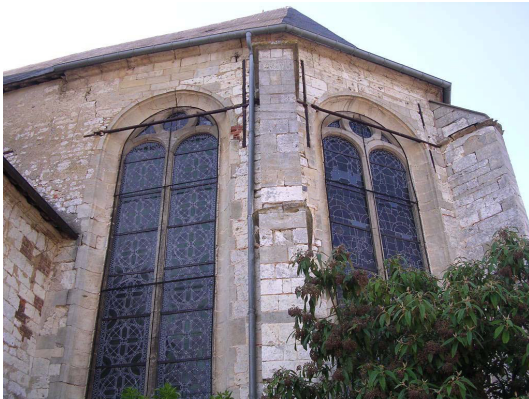
Grandes baies du chevet, renforcées par des tirants métalliques