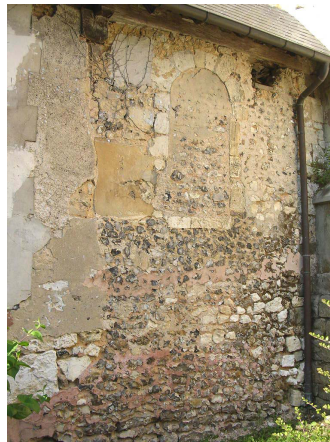
Maçonneries et baie romanes