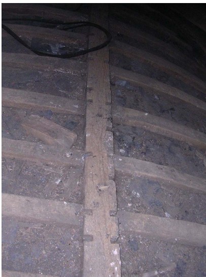
Tenons-mortaises verticaux de la sous-faîtière du chœur, avec défaut d'emplacement

Dans le chœur, la taille des tenons-mortaises dans la sous-faîtière présente une erreur d'emplacement et leur distribution le long du bois a dû être recommencée en partie. Ces tenons sont verticaux alors que ceux taillés en pied dans les liernes sont horizontaux. Cette différence d'orientation s'explique par le mode de mise de place : les cerces sont engagées en pied dans la lierne puis mortaisées en tête dans la sous-faîtière. Ces cerces sont mises en place après la pose des fermes, des pannes, des liernes et de la sous-faîtière.