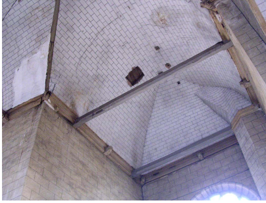
Charpente du croisillon sud

Les charpentes qui couvrent le chœur, la croisée et les deux bras du transept ont été mises en place ensemble lors de cette vaste campagne de travaux du milieu du XVI e siècle. Il s'agit d'un ensemble cohérent qui répond des mêmes principes structurels et dont l'ensemble des éléments est encore en place. Seul le voûtement a perdu son lambris d'origine et se trouve actuellement constitué, comme dans la nef, d'un plâtre sur lattis, peint d'un faux appareillage.