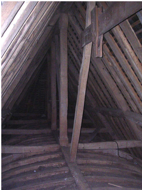
Charpente du chœur et cerces courbes de la voûte

Au-dessus de la voûte, la structure des fermes révèle une conception relativement maladroite ainsi que des bois de faible section, équarris pour certains à la hache, et débités à la scie de long pour la plupart des autres. Les arbalétriers des fermes sont raidis par un seul niveau de faux entrants, assemblés aux flancs du poinçon haut. Ce dernier réceptionne le cours d'une panne faîtière et d'une sous-faîtière que deux longs liens obliques relie de façon assez maladroite. En effet, en raison de la portée de la faîtière et du poids des chevrons qu'elle supporte, ces liens reportent sur la sous-faîtière ces charges. N'étant pas soutenue ni renforcée, les sous-faîtières ont donc plié sous cette surcharge, entraînant par endroits d'autres déformations successives, comme le tassement de la voûte. Dans le croisillon sud, une suspente métallique a été rajoutée pour soulager la sous-faîtière, particulièrement déformée.