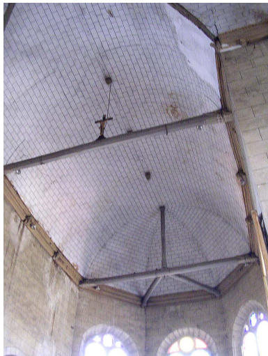
Charpente du chœur