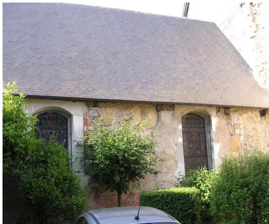
Mur sud de la nef