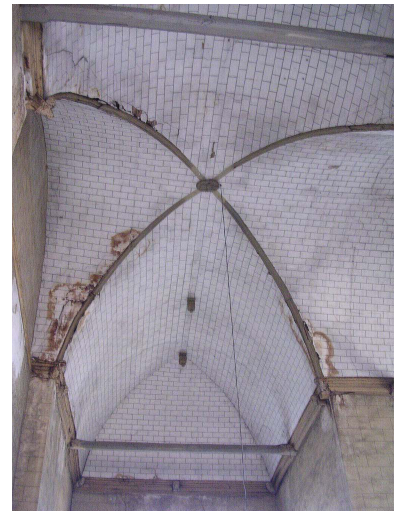
Charpente de la croisée du transept et du croisillon nord