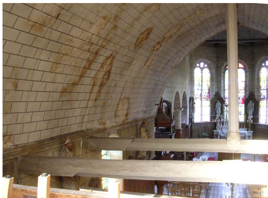
Charpente voûtée de la nef