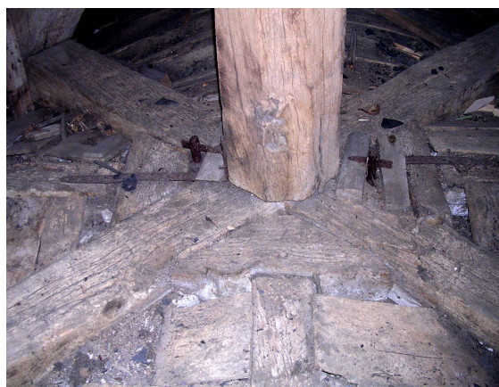
Assemblages des entrails retroussés au poinçon, aux étrépillons et aux sous-faîtière (au 1 er plan), voir les tiges métalliques de suspension de la sculpture

Des courts étrépillons relient les entrails retroussés afin de pouvoir garantir l'assemblage des sous-faîtières des quatre vaisseaux. A chaque ferme, un couple d'aiseliers et de jambes de force courbes définissent le tracé d'une arcature en plein cintre qui assure la jonction des voûtes des quatre vaisseaux. Il faut noter la complexité du tracé d'épure à l'origine de cette voûte de croisée qui a dû permettre la jonction de quatre voûtes en tiers point d'ouverture distincte (la voûte du vaisseau central est plus large que celles des croisillons) sur deux arcatures en plein cintre. Il faut aussi souligner l'absence d'entrait à la base de cette croisée, pourtant soumise à de très fortes poussées puisqu'elle récupère les pannes des quatre vaisseaux. Cette prouesse a été permise du fait de la proximité de fermes principales dans chaque vaisseau qui assuraient une retenue suffisante des poussées. Cette astuce permettait de libérer l'espace de la croisée du transept et produire ainsi une impression de profondeur. La suppression des entrails du chœur et notamment de celui de la ferme située à proximité de cette croisée a donc libéré ces poussées latérales et l'ouverture des fermes de la croisée. Il ne faut donc pas s'étonner de voir des déformations au niveau des deux fermes de la croisée et à la naissance du chœur, c'est-à-dire dans la zone où les poussées se rejoignent, entre celles de la voûte du chœur et celle de la croisée.