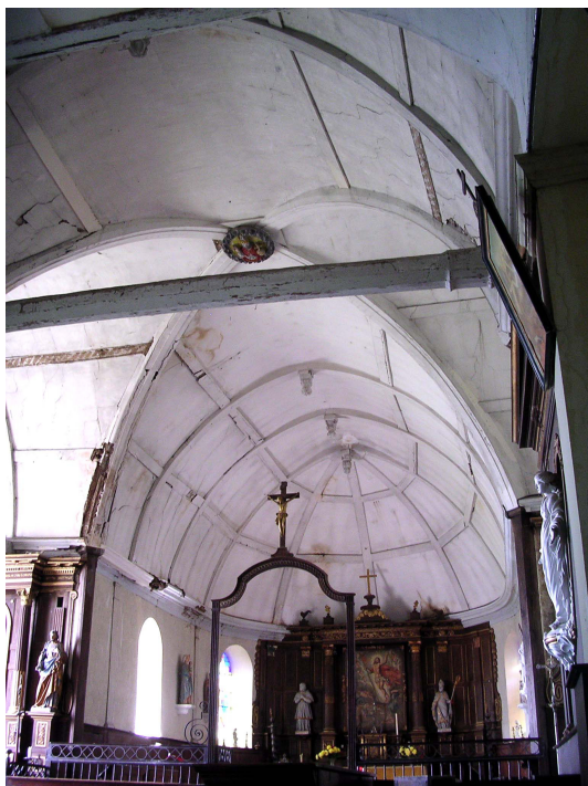
Charpente de la croisée du transept et du chœur vue depuis la nef

Cette charpente est voûtée sur les quatre vaisseaux de l'édifice et se termine sur l'abside du chœur par une croupe à quatre pans coupés. Plusieurs fermes principales à entrain subdivisent les charpentes en travées : deux sur la nef et sur chaque croisillon du transept, trois sur le chœur.