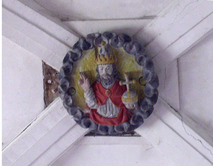
Sculpture suspendue de la croisée du transept

Les pieds des deux fermes de la croisée du transept ont été buchés vraisemblablement au XVIII e siècle. Il est fort probable que ceux-ci devaient présenter aussi des sculptures à chaque extrémité des blochets (pièce recevant le pied de l'arbalétrier et de la jambe de force).