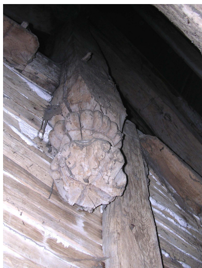
Cul de lampe d'un pignon

Lors d'un sondage de la voûte réalisé en juin 2005, la structure interne de la voûte a pu être observée. Il s'avère que les cerces, les éléments des fermes et les liernes sont toutes moulurées et que les planches sont encore conservées en l'état, sans trace de décor polychrome. Le bacula fixé au XVIII e siècle n'a pas trop altéré les moulures et l'état primitif de la voûte du XVI e siècle peut être restitué sans trop de travaux de réfection, seules quelques planches doivent être remplacées. Les sablières ont toutefois été très dégradées et leur état ne mérite pas leur conservation, elles doivent être remplacées.