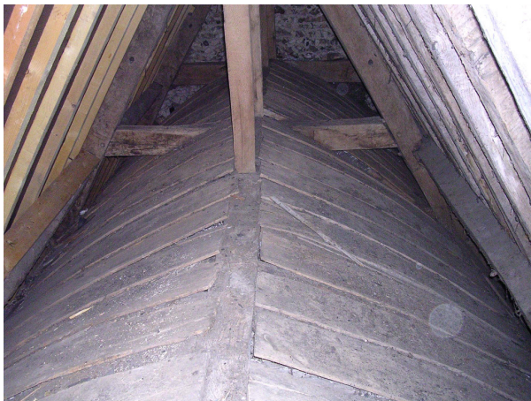
Structure supérieure de la voûte

Le cloisonnement de cette ossature est assuré par de fines planches de 23 cm de large, de 1,50 à 1,60 m de long, et épaisses de 1,3 cm en moyenne, qui viennent recouvrir extérieurement ces cerces. Ces fines planches sont donc appliquées verticalement entre chacune de ces cerces, et sont clouées sur leur pourtour aux rebords des cerces. Obtenues également par débitage, ces planches assurent donc le revêtement de la voûte d'origine. Elles sont encore toutes en place, même si nombre d'entre elles sont en mauvais état. Après un examen rapide de leur face interne, il s'avère que ces planches, comme les liernes et les cerces, ne présentent aucune trace de peinture, mais seulement un enduit blanc à la chaux.