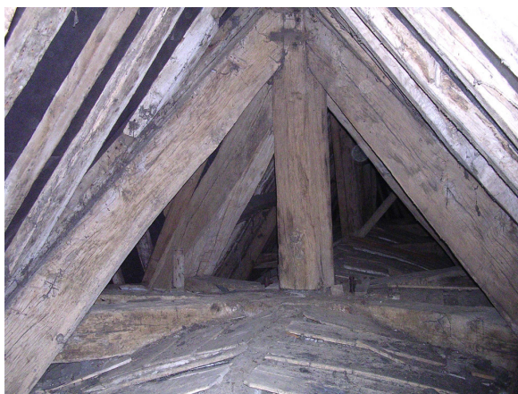
Croisée des deux fermes dans le poinçon central