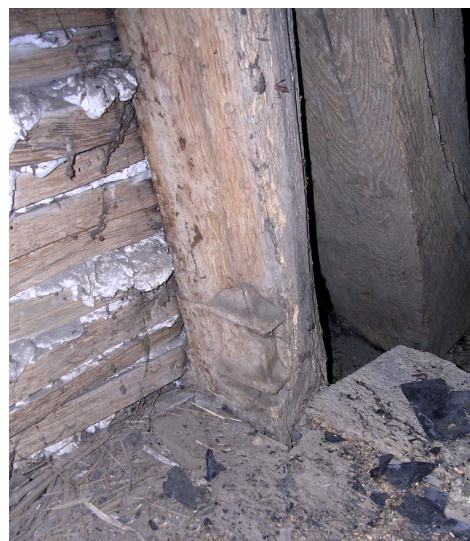
Pied mouluré d'un aisselier

La croisée du transept présente une originalité structurelle qui mérite d'être évoquée ici. En effet, la charpente qui la couvre est composée de deux fermes croisées, faisant office de noues aux toitures, dépourvues dès l'origine d'entrait. Ces deux fermes sont constituées chacune d'un couple d'arbalétriers de forte section pour recevoir les pannes de chaque toiture, d'un entrait retroussé venant s'assembler à un poinçon haut commun aux deux fermes. Un seul de ces entrails retroussés est continu, l'autre est constitué de deux morceaux assemblés aux flancs du précédent. Le poinçon-haut vient, quant à lui, se tenonner dans l'entrait continu, en face supérieure, il n'est donc pas traversant.