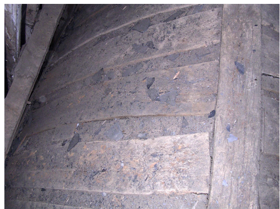
Vue rapprochée des planches clouées aux cerces

Il faut donc souligner ici le fait que l'essentiel de la structure de la voûte d'origine est encore en place et se trouve dissimulée au regard par le badigeon en plâtre du XVIII e siècle.