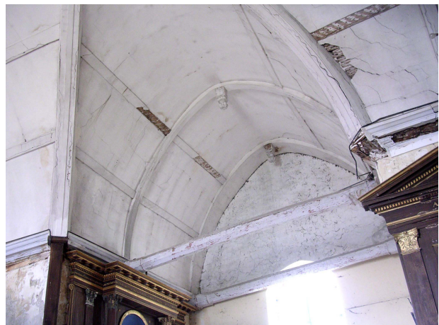
Charpente du croisillon nord

Au XVIII e siècle vraisemblablement, un badigeon blanc en plâtre a été appliqué sur les voûtes et sur l'ensemble des pièces de charpentes apparentes. Les entrains des trois fermes du chœur ont été alors supprimés afin de libérer le volume et pour ne pas dissimuler le nouveau retable. Cette amputation des entrains a entraîné plusieurs désordres structurels. En effet, privées de leur tirant, les fermes se sont ouvertes sous les poussées latérales de la couverture, provoquant la déformation de la voûte du chœur, de la croisée du transept, ainsi que le dévers du mur sud du chœur. La présence de contreforts au sud du chœur a permis de limiter le dévers du mur mais il serait utile sur le long terme de pallier ces poussées latérales en remettant en place des tirants à la place des précédents entrains, sous la forme de câbles métalliques.