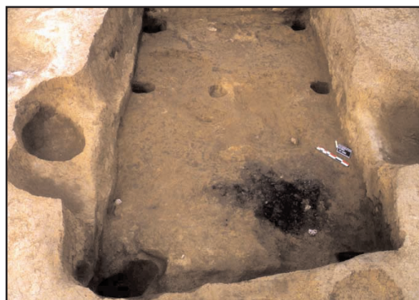
Fig.49 : la cabane 2095 de Villiers-le-Sec qui sert de modèle au projet