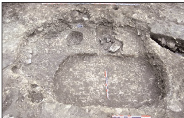
Fig. 48 : cabane de grande taille profondément creusée dans le calcaire sur le site d'Orville (st 3763)

La superstructure, reposant vraisemblablement sur sablière basse, ne permet pas de définir exactement l'aménagement architectural, Ce qui nous conduit à l'écarter comme modèle direct, même si sa présence prouve l'existence de fond de cabanes profonds et de