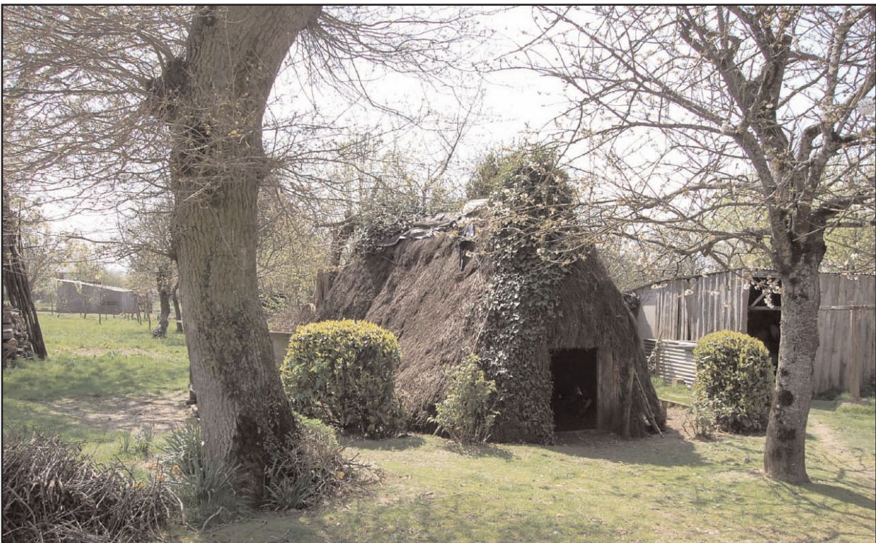
Fig. 52 : Lanouée (56), le Quéstel, loge à sol excavé et poteaux plantés, début XXe s.

fonctionnel, il s'avère que la plupart des loges au sol excavé servaient au stockage de fûts de cidre. L'excavation et les levées des terres extraites du creusement et disposées sur le pourtour de la loge assurent en effet une bonne isolation thermique et une humidité constante. La couverture en bruyère ou en chaume renforçait cette hygrométrie stable. En outre, ces loges servaient aussi au stockage d'outils divers, et d'aliments parfois. En Bretagne, des saloirs (grands pots remplis de sel dans lequel on mettait de la viande) étaient disposés au