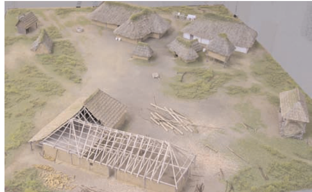
Fig.51 : maquette d'une unité carolingienne de Villiers-le Sec

L'étude réalisée sur des bâtiments à poteaux plantés appelés "loges" (voir bibliographie et fig. 52), construits au début du XXe siècle, entre Tours et Angers, et en Bretagne a permis de mettre en évidence des techniques de construction similaires à celles mises en oeuvre au cours du haut Moyen Âge : sols excavés, poteaux plantés, couvertures végétales, et ce pour des bâtiments de 15 à 100 m 3 . Ces exemples permettent d'avancer des choix de restitution fiables sur le plan structurel et technique (choix des matériaux, disposition des poteaux, structure de comble...). Sur le plan