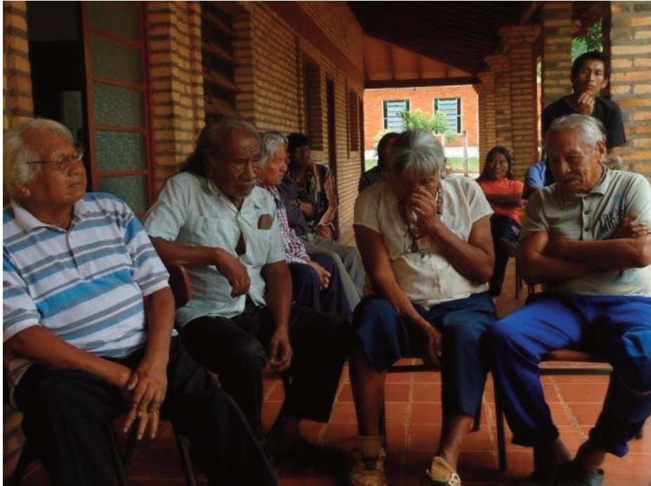
Figura 3. Líderes maká, Asunción, 2012.