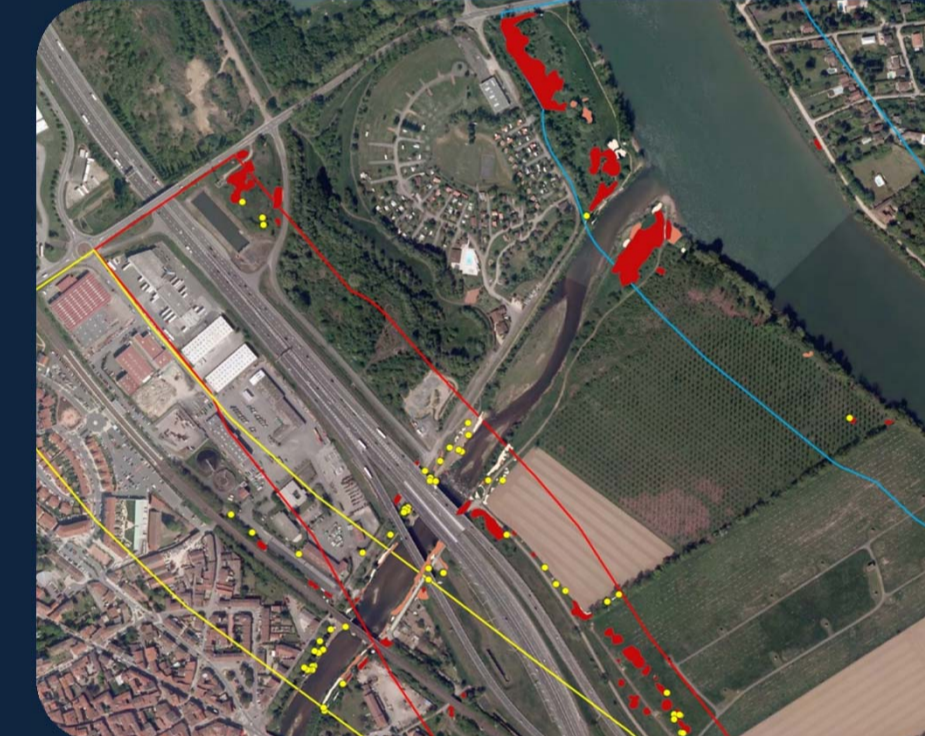
Echelle du paysage