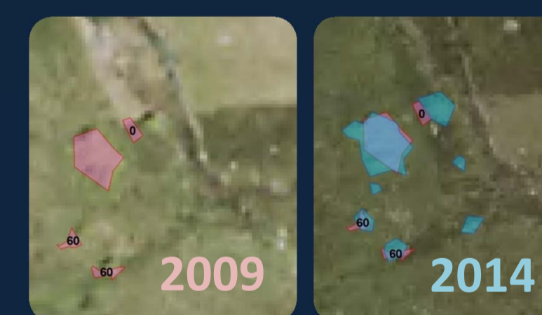
Echelle de la tache