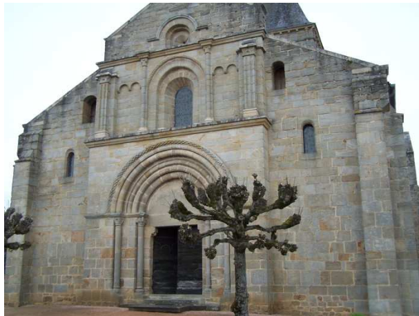
III. n° 5 - Eglise de Varenne-l'Arconce

Le recours à la pierre de taille est parfois justifié par des raisons techniques, de solidité en particulier : à l'église de Jonzy, les bâtisseurs ont recouru à un blocage de moellons bruts pour la nef, mais à un appareil de moellons équarris pour le transept et l'abside. Ce choix correspond peut-être aux différences de couverture : la nef est charpentée, un mode de couverture qui n'exerce aucune force sur les murs gouttereaux, tandis que les parties orientales sont voûtées et requièrent de fait une structure plus solide.