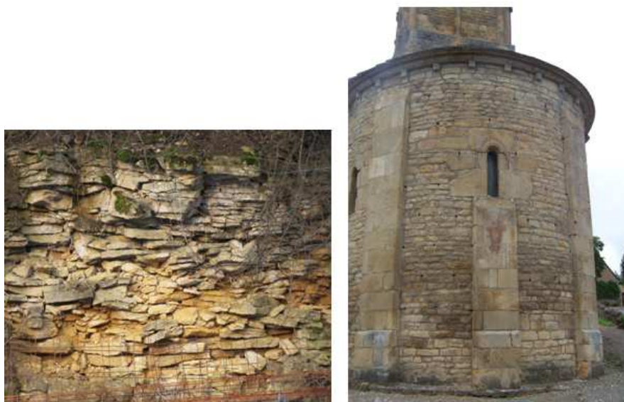
III. n° 4 - Carrière du Crot Cornet et église de Vareilles

nir un appareil assisé. Un travail plus rapide consiste à ne donner aux petits moellons qu'une forme grossièrement rectangulaire, comme c'est le cas à l'église de Saint-Martin-de-Lixy. Si les moellons sont laissés bruts et jetés dans un bain de mortier, ce n'est plus un appareil mais un blocage : ce type de maçonnerie a été retenu pour la nef de l'église de Jonzy, par exemple. Les chailles, une roche siliceuse abondante en Brionnais, sont si dures qu'elles résistent au ciseau du tailleur ; elles ne peuvent être qu'éclatées et mises en œuvre dans un blocage : l'absidiole de Saint-Martin-la-Vallée en offre un bel exemple.