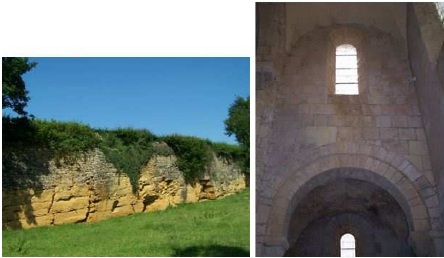
III. n° 3 - Carrière du Mont et priorale d'Anzy-le-Duc

Taillleurs de pierre et maçons ont façonné les matériaux afin d'en tirer le meilleur parti. La carrière du Mont, à Anzy-le-Duc, offre des bancs épais et réguliers de calcaire à entroques. C'est donc là que l'on extrayait les blocs de grands modules utiles à la réalisation d'appareils en pierres de taille réglés.