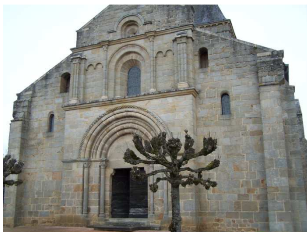
III. n° 5 - Eglise de Varenne-l'Arconce

Le recours à la pierre de taille est parfois justifié par des raisons techniques, de solidité en particulier : à l'église de Jonzy, les bâtisseurs ont recouru à un blocage de moellons bruts pour la nef, mais à un appareil de moellons équarris pour le transept et l'abside. Ce choix correspond peut-être aux différences de couverture : la nef est charpentée, un mode de couverture qui n'exerce aucune force sur les murs gouttereaux, tandis que les parties orientales sont voûtées et requièrent de fait une structure plus solide.