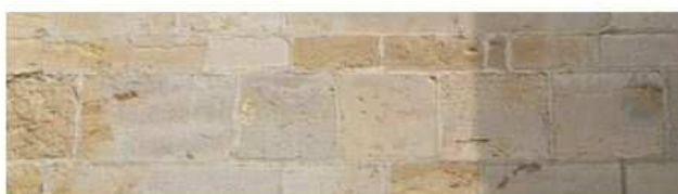
Calcaire à entroques (Semur-en-Brionnais)

Illustration n° 1 - Le calcaire à entroques permet la taille de blocs réguliers à arêtes vives, contrairement aux grès et aux granites.