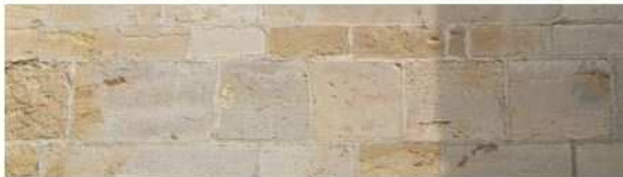
Calcaire à entroques (Semur-en-Brionnais)

Illustration n° 1 - Le calcaire à entroques permet la taille de blocs réguliers à arêtes vives, contrairement aux grès et aux granites.