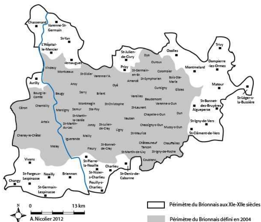
Carte n° 1 – Étendue du Brionnais aux XI e et XII e siècles.

des XI e et XII e s. 7 L'emprise du Brionnais médiéval était plus vaste qu'aujourd'hui et débordait sur les départements actuels de la Loire, du Rhône et de l'Allier (carte n° 1). Les deux familles seigneuriales ont rendu le Brionnais autonome, elles lui ont conféré une unité et une histoire propres. C'est l'Histoire qui donne sa cohérence à un territoire dont la géologie et la géographie sont hétérogènes. Visuellement, cette cohérence territoriale s'accompagne de la création d'un paysage monumental tout neuf, puisque dans chaque paroisse s'ouvre le chantier d'une église.