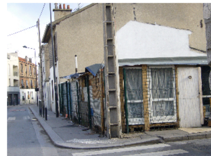
1er site. 2010

Conception : E. Roche & S. Ah Leung - réalisation : E. Roche, EYS-ITUS-INSA de Lyon, 2012