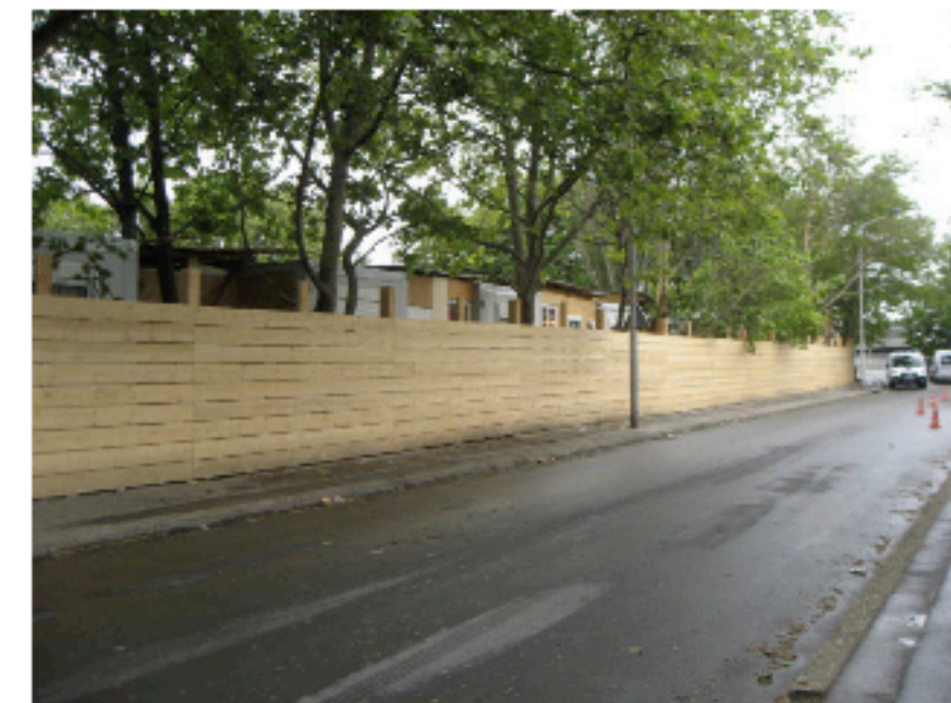
3ème site (Photo ER). 2012