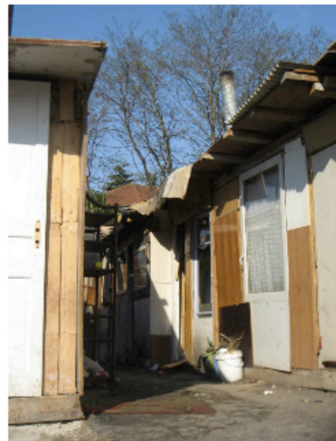
2ème site. 2012.