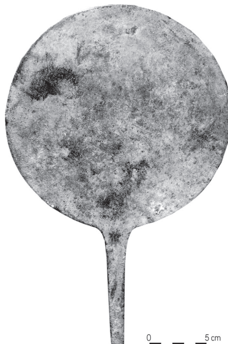
Figure 2 - Photographie du miroir RS 27.083, d'après un document conservé dans les archives de la mission de Ras Shamra, fonds Schaeffer, Collège de France.