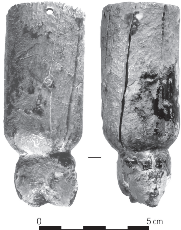
Figure 7 - Manche de miroir (?) en ivoire (RS 14.181), Palais royal d'Ugarit, © Mission de Ras Shamra.

Un ivoire d'Ugarit pourrait encore illustrer ce type. Nous proposons en effet d'identifier l'objet RS 14.181, en ivoire d'hippopotame, à un manche de miroir. Il provient du locus 29 du Palais royal d'Ugarit (secteur central) et il a été retrouvé sur le sol du Bronze récent III (point topographique 220, profondeur 2,70 m) 65 (figure 7).