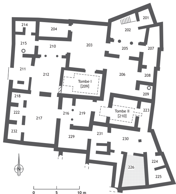
Figure 3 - Plan schématique du Palais Sud, © Mission de Ras Shamra, d'après YON 1997, infographie E. Croidieu.

en bronze, sorte de pelle à galette, très bien conservé » 7 (figure 4). Cette interprétation est-elle fondée pour partie sur les dimensions importantes de l'objet ou sur l'identification proposée par les fouilleurs de l'aménagement en pierres dans lequel il a été retrouvé, qui serait un « four » ?