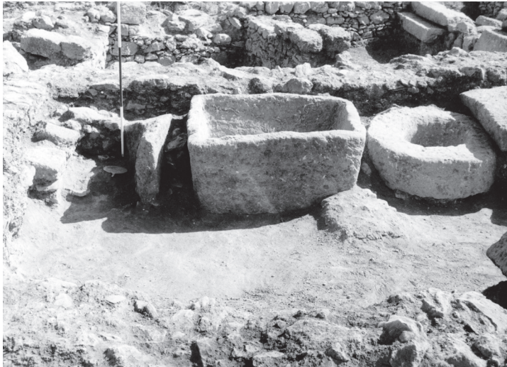
Figure 4 - Le miroir RS 27.083 in situ dans le locus 226 du Palais Sud, archives de la mission de Ras Shamra, fonds Schaeffer, Collège de France.