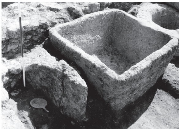
Figure 6 - Le miroir RS 27.083 in situ , Palais Sud, archives de la mission de Ras Shamra, fonds Schaeffer, Collège de France.

La structure où a été retrouvé le miroir se situe dans l'angle nord-est, à côté de la cuve. En forme de U, elle est construite en moellons et conservée sur une hauteur maximale de 0,55 m (figure 6). Cette installation a donc été interprétée comme un four par les fouilleurs, mais nous n'avons retrouvé aucune mention de couche(s) de cendres, ni à l'intérieur, ni à l'extérieur dudit four. Et Y. Calvet 11 , lors des observations qu'il réalisa sur place, ne releva pas la présence d'enduit sur les parois de la structure.