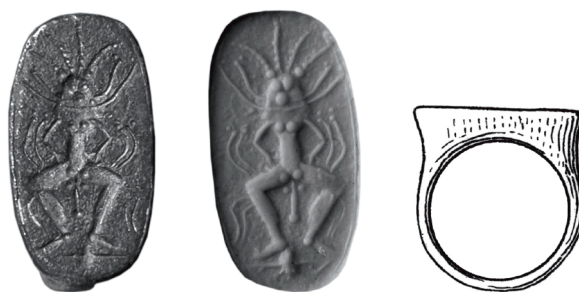
Figure 1 - Bague en argent décorée de la figure de Bès (RS 21.37, Damas), Ras Shamra.

1a : vue du chaton de la bague, H. 1,98 cm