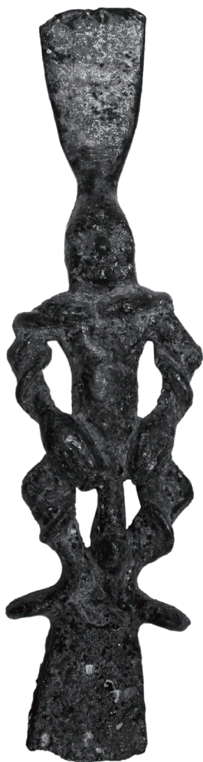
Figure 3 - Spatule double décorée de la figure de Bès (RS 21.131, Damas 5722), alliage cuivreux, H. 10,2 cm.

parallèle égyptien 26 et l'interprétation de cette pièce reste délicate. L'objet a été publié et interprété comme un poids 27 , mais il n'est pas exclu qu'il puisse s'agir d'un élément de petite statuaire. Il est difficile de trancher, car la base de l'objet a été plâtrée, cette intervention de restauration empêchant toute observation 28 .