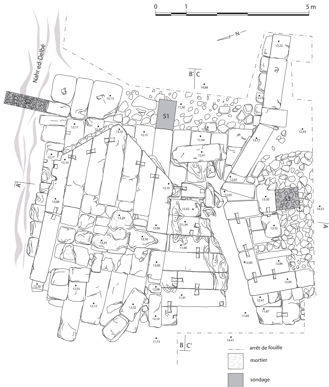
Fig. 2 - Plan du pont-barrage au sud de Ras Shamra (état de la fouille en 2009) (© mission de Ras Shamra, dessin E. Devidal).

L'aménagement barre le cours d'eau au moyen d'une pile centrale et de deux massifs d'ancrage implantés sur les rives (fig. 2). De ces derniers, seul celui du sud est conservé. Les deux passes ainsi ménagées pouvaient être fermées au moyen de poutrelles, glissées dans des encoches taillées dans la pile et dans les massifs d'ancrage. La découverte, en 2008, d'un bloc à rigole, basculé dans une des passes du barrage, nous donne à penser que l'une de ses fonctions pouvait être l'irrigation. Nous supposons que l'ouvrage servait aussi de pont, assurant la bonne circulation vers la ville en autorisant le franchissement du cours d'eau, mais il créait surtout et avant tout une précieuse réserve en eau à proximité immédiate de la cité 19 .