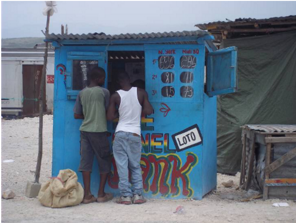
Photo 1 - Banque de borlette Père Éternel dans la région de Malpase (2010)

n'existaient pas. Nous avons pu ainsi assister à l'ouverture de la première de ces banques dans la commune des Abricots. Cette diffusion s'accompagne souvent d'un accès à l'électricité puisque les résultats des tirages étatsuniens sont connus par téléphone portable, télévision ou radio. La dichotomie rural/urbain de ces jeux serait donc en train de s'effacer au fur et à mesure que les réseaux de communication pénètrent dans les mornes, de plus en plus reliés avec le reste du monde.