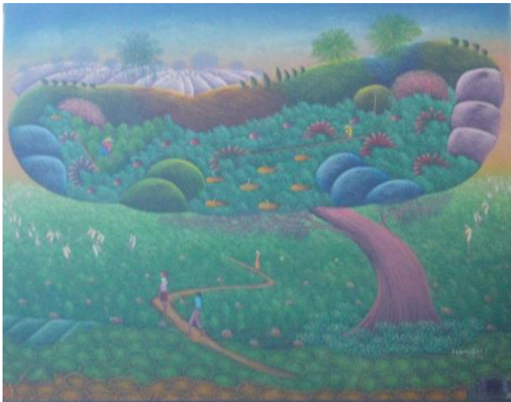
Photo 4 - Un exemple de peinture haïtienne : géographie et métagéographie ?

une martingale. La peinture haïtienne reflète parfois cette superposition de mondes (voir photo 4) en figurant un paysage de champs cultivés, de collines et au-dessus, un autre paysage qui lui fait écho de façon onirique : les champs y sont plus verts, plus doux aux travailleurs.