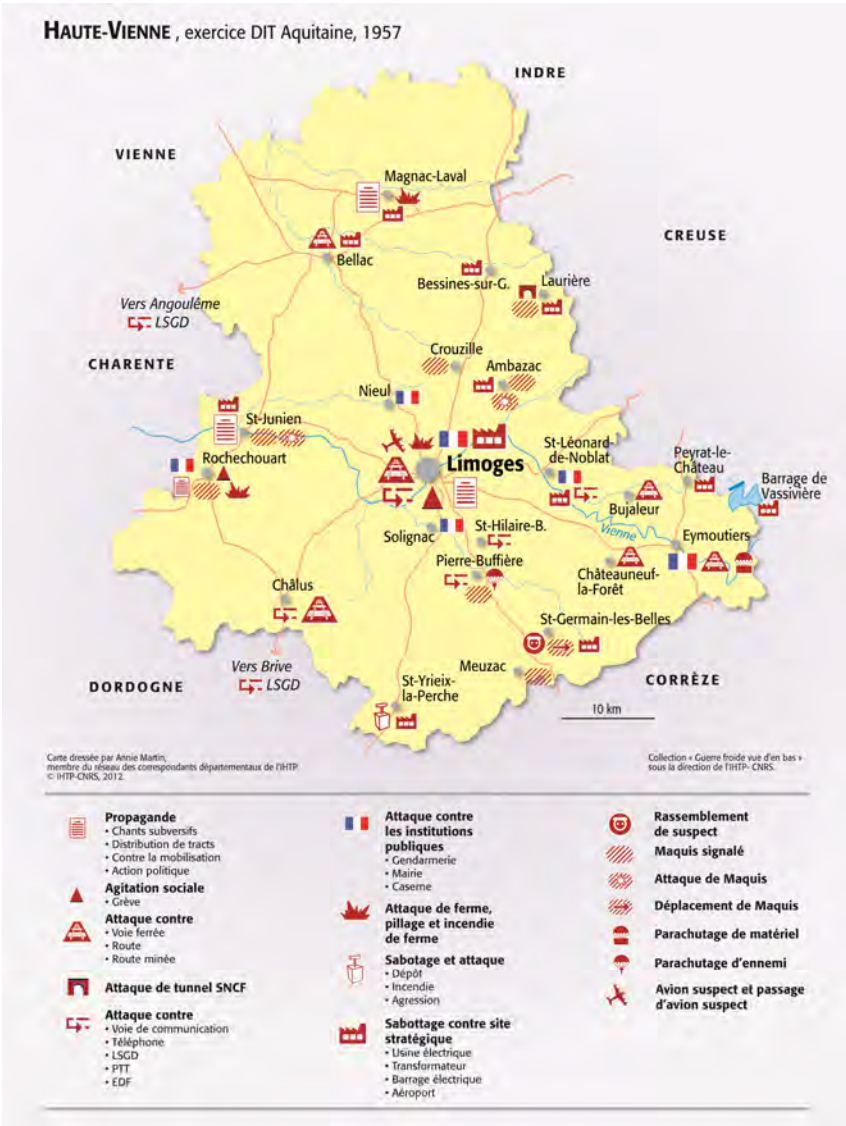
Haute-Vienne, exercice DIT Aquitaine 1957.