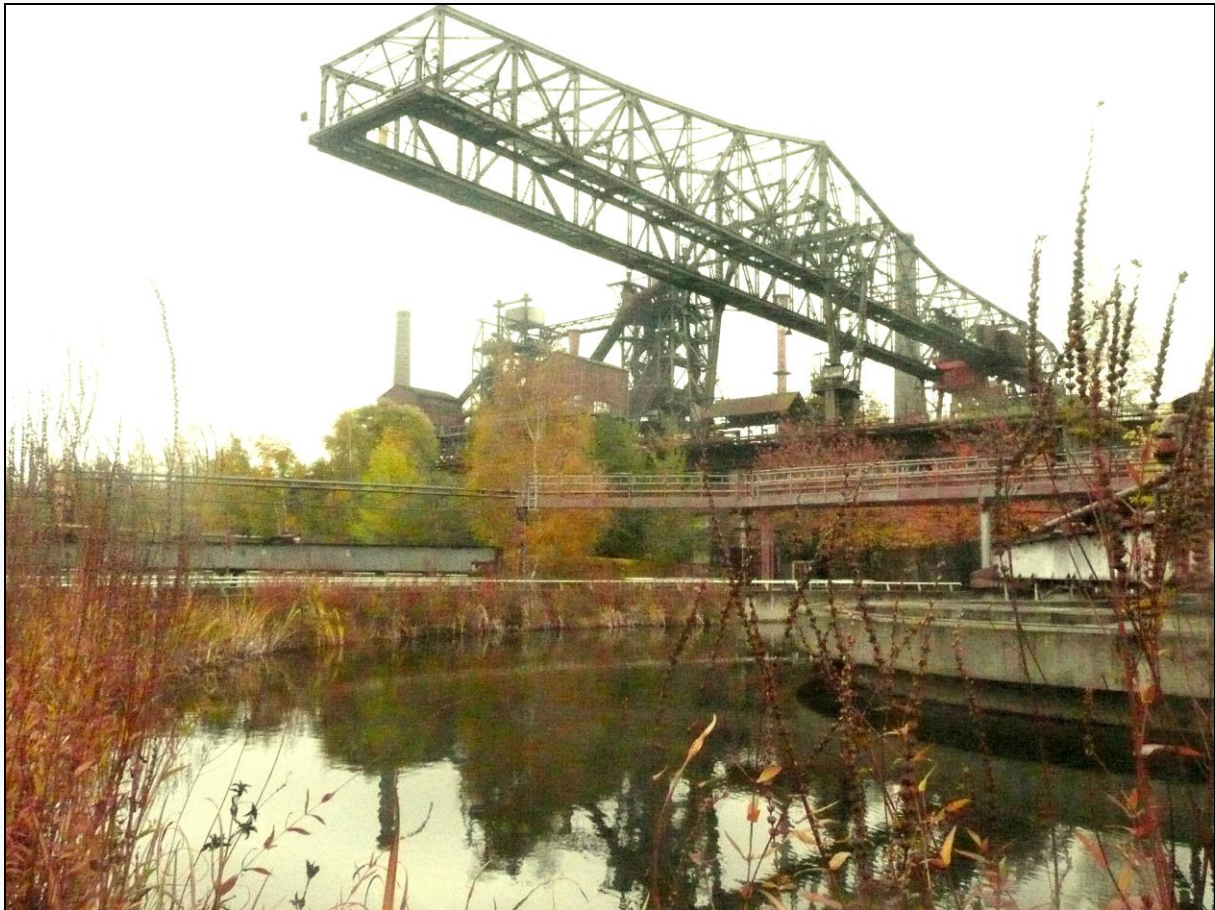
Figure 2 : le parc paysager de Duisbourg Nord (Allemagne). Les plantes aquatiques gagnent les anciens bassins de décantation, et une végétation spontanée dominée par les bouleaux se mêle aux bâtiments désaffectés.

Les parcs naturels allemands ne protègent donc pas tellement une belle nature, statique et coupée de la société, mais bien une portion de territoire dans laquelle l'état initial de nature importe bien moins que l'état ultime à atteindre. Chaque parc national, par exemple, n'exclut aucunement les activités humaines mais cherche à les limiter, en accord avec les objectifs de la protection, sur un quart de sa surface environ, et travaille sur la restauration écologique d'autres sites. La société participe alors pleinement à l'accomplissement de cet objectif de renaturation en apportant la nature dans la culture, puis en contribuant à sa bonne gestion : des projets concertés avec les riverains sont ainsi envisagés dans une stratégie gagnant/gagnant de visites naturalistes des sites protégés, de mise en valeur touristique durable avec labels environnementaux et marque déposée pour le marketing régional, etc. La protection consiste donc bien moins en une mise à l'écart d'un territoire de nature qu'en l'accompagnement d'une évolution vers plus de durabilité, ce qui signifie aussi une réelle mise en valeur sociale de cette évolution.