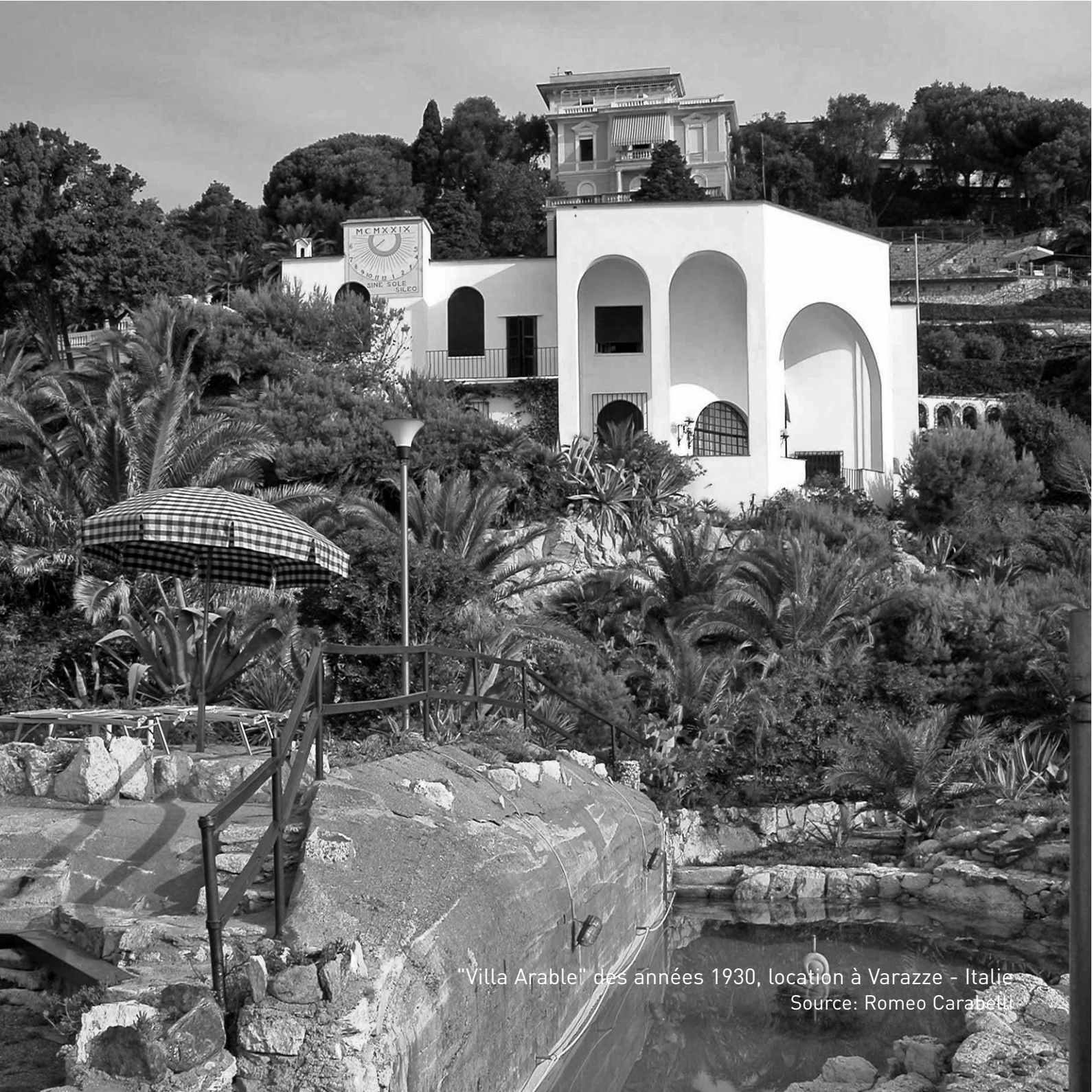
"Villa Arable" des années 1930, location à Varazze - Italie