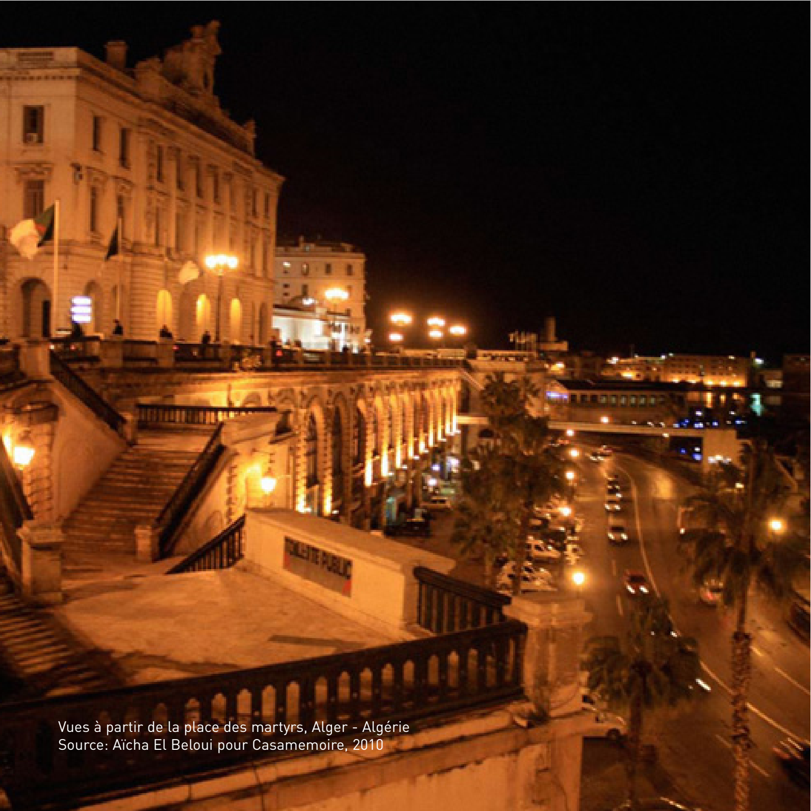
Vues à partir de la place des martyrs, Alger - Algérie