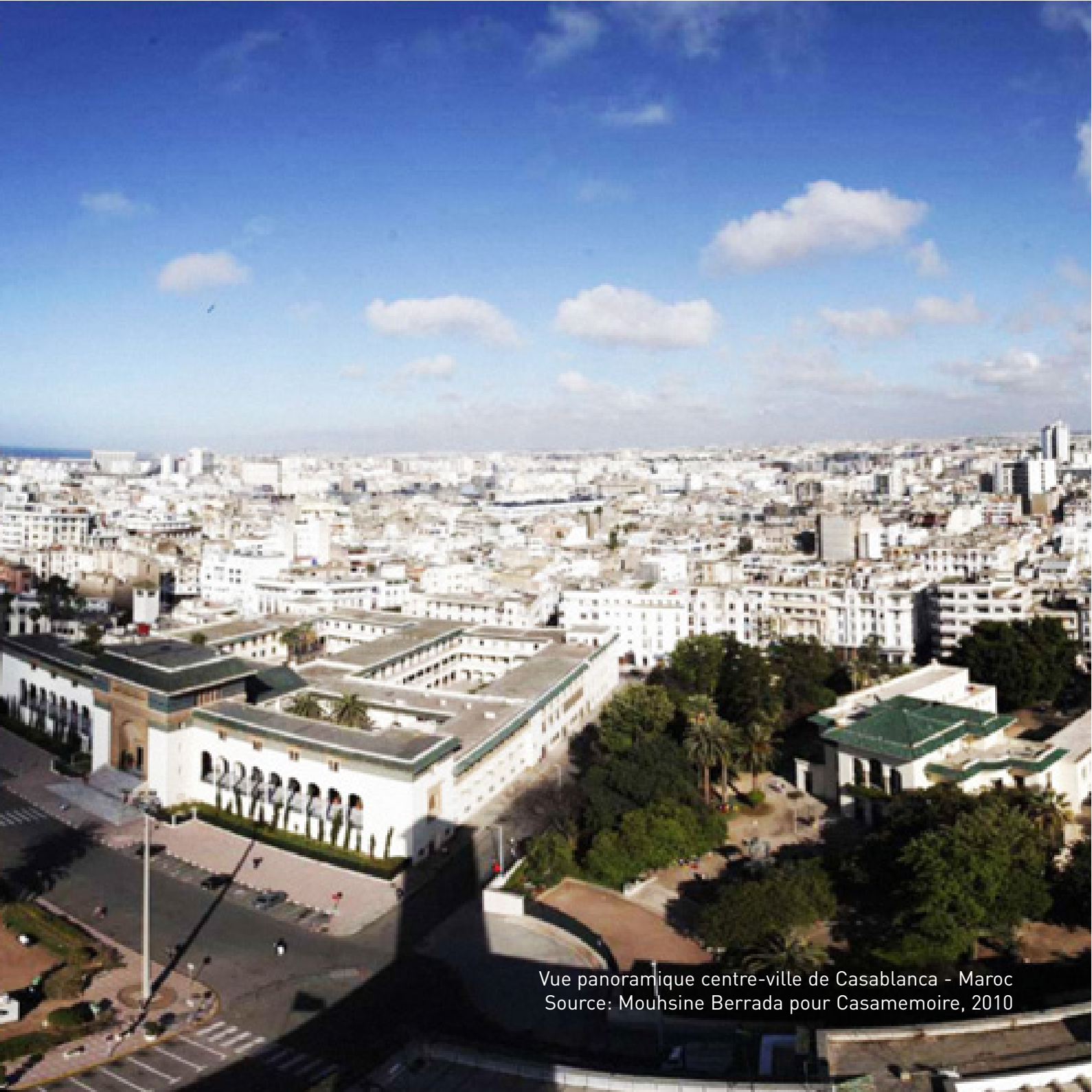
Vue panoramique centre-ville de Casablanca - Maroc Source: Mouhsine Berrada pour Casamemoire, 2010