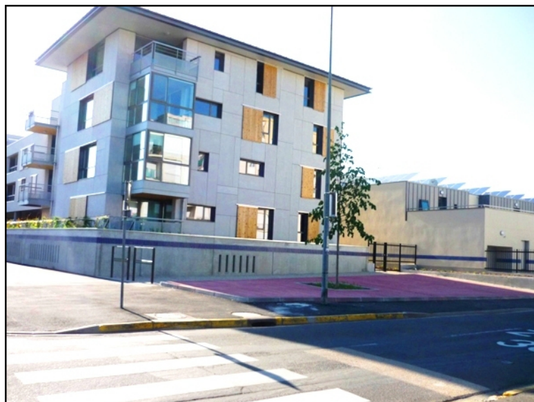
Illustration 5 - La représentation de l'inondation dans l'urbanisme : la ligne d'eau