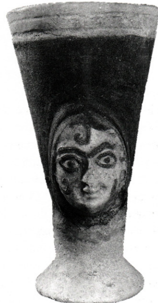
Figure 5. Gobelet à visage (faïence), Minet el-Beida, tombe VI, fouilles 1932. Louvre AO 15725.

Des gobelets de ce type apparaissent dès les premières campagnes (du début des fouilles jusqu'à aujourd'hui, nous avons répertorié onze spécimens complets ou fragmentaires). En 1933, C. Schaeffer écrit à propos du mobilier de la tombe VI de Minet el-Beida : « Nous avons trouvé plusieurs faïences et porcelaines intactes. Les plus remarquables sont de hauts gobelets ornés de masques féminins en deux ou trois couleurs. L'expression fixe des yeux, la petite bouche souriante et les mèches de cheveux aplaties,