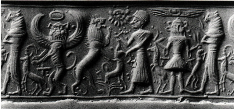
Figure 2. Impression (moderne) d'un sceau-cylindre chypriote trouvé dans la maison de Rapanou. (RS 20.039 = Amiet, 1992 n° 452).

Certaines productions comme la glyptique laissent apercevoir la présence d'œuvres assez clairement issus d'ateliers égéens. Dans son étude récente de la glyptique d'Ougarit, P. Amiet reconnaît, parmi les 555 sceaux-cylindres en hématite et pierres diverses répertoriés, 35 spécimens chypriotes du Bronze Récent (Fig. 2) et un spécimen crétois 26 . Et pour la vaisselle et instruments de bronze , H. Catling reconnaît comme probablement chypriotes certains supports culturels : à celui qui fut découvert autrefois dans la « Maison du Grand Prêtre » 27 est venu s'en ajouter un autre, miniature, provenant du « Sanctuaire aux rhytons » 28 .