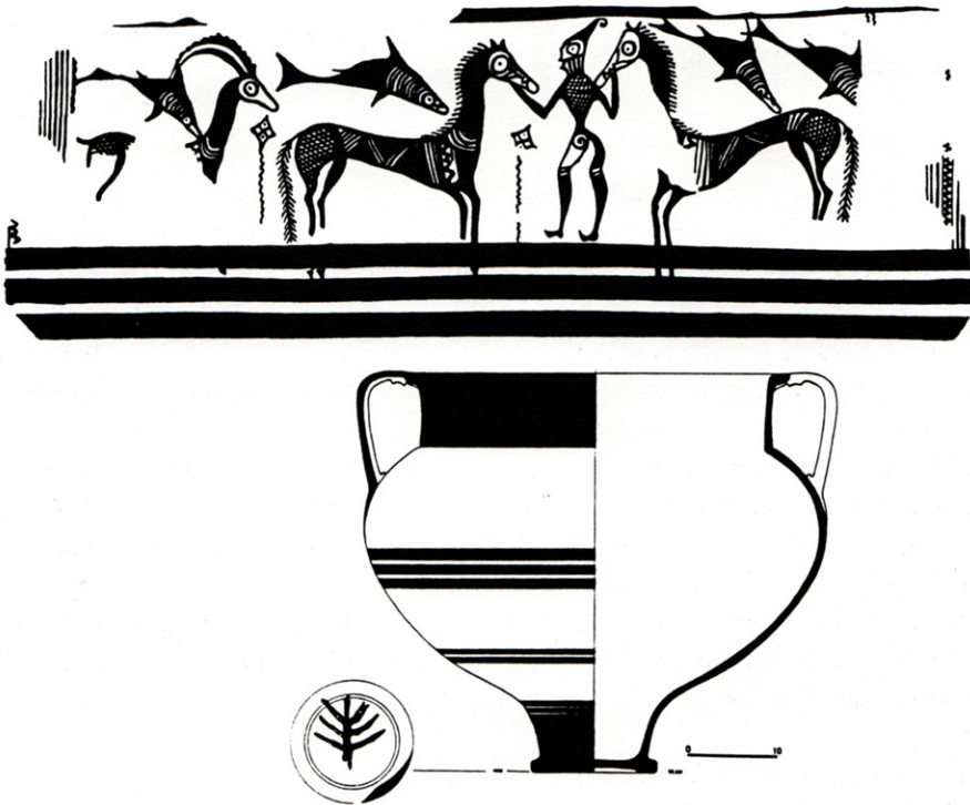
Figure 3. Cratère mycénien du « Maître des chevaux », RS 27.319, Palais Sud (d'après Ugaritica VII, 1978, p. 346-350).

Il est vrai cependant que si l'on s'attache à des ensembles particuliers de mobilier comme celui qui provient de tombes ou de sanctuaires, la proportion d'importations égéennes augmente parce qu'il s'agit de matériel de luxe : ainsi, parmi les dix-sept rhytons (vases cultuels) retrouvés récemment à proximité du « Temple aux rhytons », M. Yon 35 décompte onze exemplaires du Mycénien III B, un spécimen minoen, et enfin un rhyton chypriote (de fabrique Base Ring ).