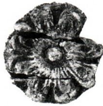
Figure 6. Perle en verre moulée importée de Grèce (« Centre de la ville », RS 86.5010).

Dans l'état actuel de nos connaissances, le seul objet retrouvé à Ras Shamra que l'on puisse considérer comme une importation véritablement égéenne est une perle en verre moulé décorée d'une rosace (Fig. 6) et découverte en 1986 dans la zone du tell dite « Centre de la ville » (Inv. RS 86.5010). Les seuls parallèles que nous ayons pour cette pièce ont été retrouvés en Égée : en Grèce, à Rhodes, en Crète 70 . Selon D. Barag 71 , une industrie égéenne du verre a, semble-t-il, vu le jour dès le XV e siècle sous l'influence de la Mésopotamie. Cet artisanat produisit principalement des perles et des ornements moulés, particulièrement populaires aux XIV e et XIII e siècles. Parmi les formes caractéristiques se trouve cette perle illustrée par la trouvaille d'Ougarit. L'auteur avait suggéré que l'emploi exclusif de verre bleu dans l'artisanat égéen était peut-être dû à l'importation de lingot de verre. La découverte récente de lingots de verre bleu dans l'épave d'Ulu Burun semble être un élément supplémentaire en faveur de cette hypothèse 72 , confortée par un texte d'Ougarit 73 qui nous apprend que l'on exportait du « mekku », c'est-à-dire du verre 74 .