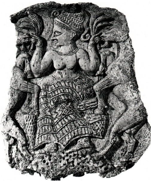
Figure 4. Couvercle de pyxide (ivoire d'éléphant), Minet el-Beida, tombe III, fouilles 1931. Louvre AO 11601.

Il en va de même pour certains objets de « faïence 54 », considérés d'abord comme mycéniens puis comme relevant d'ateliers locaux. Le type le plus connu de cette catégorie d'objets est certainement celui des gobelets en « faïence » décorés en relief d'un ou deux visages féminins (Fig. 5). Dès 1928, avant les premières découvertes sur le site d'Ougarit, R.H. Hall, à propos de plusieurs objets découverts à Assur, parmi lesquels un gobelet de ce type, écrit un article intitulé « Minoan Fayence in Mesopotamia » 55 . Il rapproche ces découvertes d'objets similaires découverts à Enkomi, et conclut à l'origine minoenne de ces vases en se fondant sur l'apparence de la glaçure (proche selon lui de celle de la déesse aux serpents de Cnossos), et sur l'art du modelé. Ce seraient les mêmes artisans qui auraient fabriqué les spécimens de Chypre et d'Assur, ces derniers objets étant considérés comme passés par Chypre.