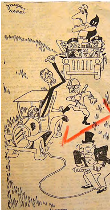
Caricature de Jules Moch n° 3, France Nouvelle , 13 novembre 1948.