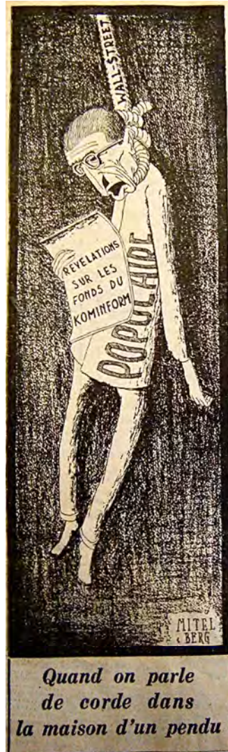
Caricature de Jules Moch n° 2 Action , 1 er décembre 1948.