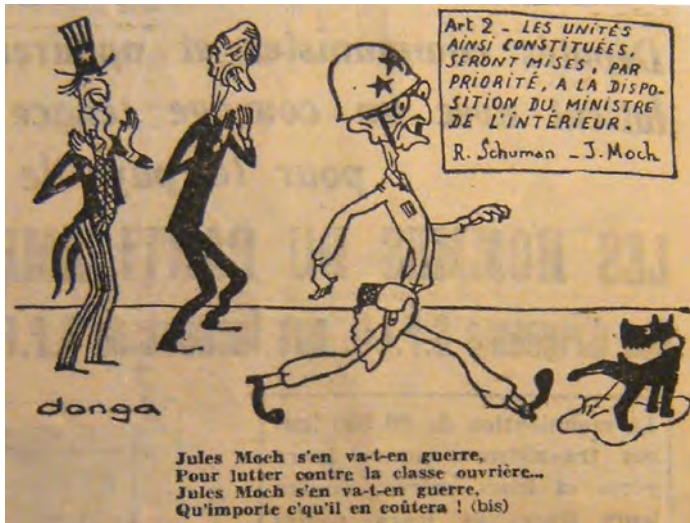
Caricature de Jules Moch n° 7, L'Humanité , 21 février 1949.