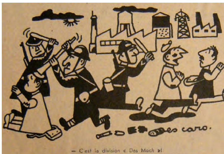
Caricature de Jules Moch n° 5, Regards , 25 novembre 1948.