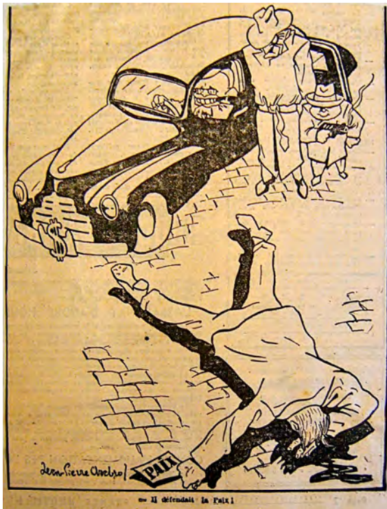
Caricature de Jules Moch n° 8, France Nouvelle , 18 décembre 1948.