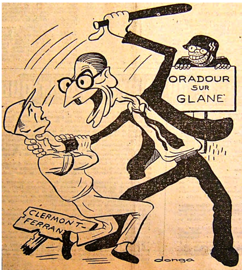
Caricature de Jules Moch n° 6, France Nouvelle , 21 juin 1948.

En 1948, Jules Moch se voit affublé d'un nouveau surnom, le « bourreau des bassins miniers » 19 . Remet-il des distinctions aux CRS à Montpellier, L'Humanité du 21 février 1949 traduit : « Tuez et vous serez récompensés ». La phrase mise entre guillemets ici fait songer à une citation et est suivie du renvoi aux années noires : « Au temps de l'Occupation, Vichy distribuait aussi des médailles aux bourreaux à ses ordres et à ceux des nazis » 20 .