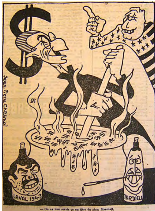
Caricature de Jules Moch n° 14, France Nouvelle , 19 novembre 1948.