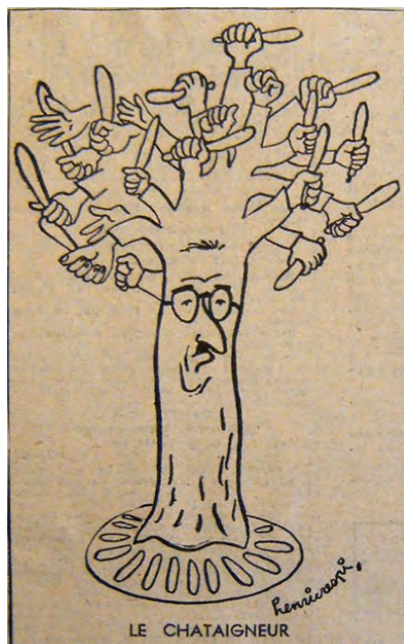
Caricature de Jules Moch n° 4, Action , 13 novembre 1948.