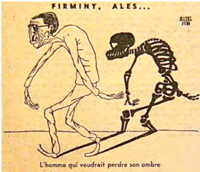
Caricature de Jules Moch n° 12, Action , 25 novembre 1948.