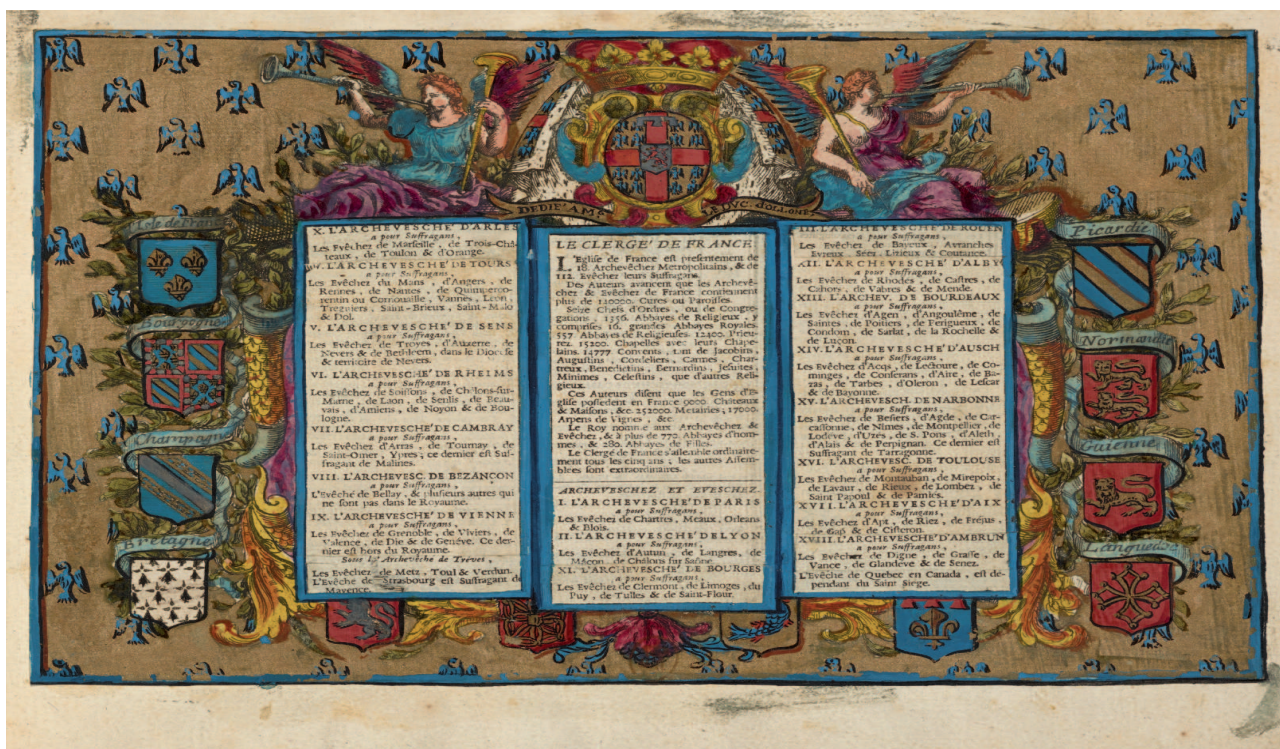
III. 11. Alexis Naquet, page de sommaire et de dédicace, BnF, Estampes, Pc-19-4.