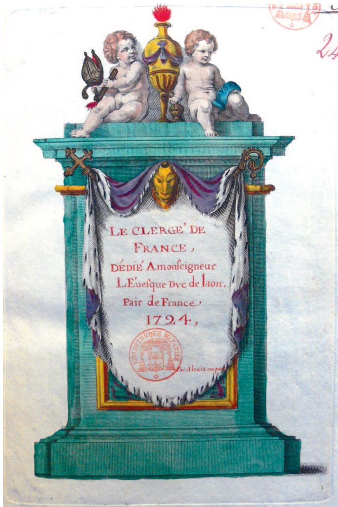
III. 8. Alexis Naquet, Le Clergé de France, dédié à Monseigneur l'évêque-duc de Laon, pair de France . 1724. Page de titre, eau-forte enluminée, 1724. Mazarine, ms 2414.