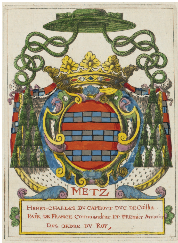
III. 2. Alexis Naquet, Armes de Henri-Charles du Cambout, duc de Coislin, évêque de Metz , burin enluminé, 1725. Arsenal, ms 6539. Le statut de Coislin lui donne droit à un manteau derrière ses armes, décoré aux couleurs de ces dernières.

procession, et un chapeau prélatice avec la corde se terminant par dix houppes (quatre rangées). En-dessous, un cadre à bordure fleurie attend une légende ; un second cadre plus petit peut accueillir une seconde inscription.