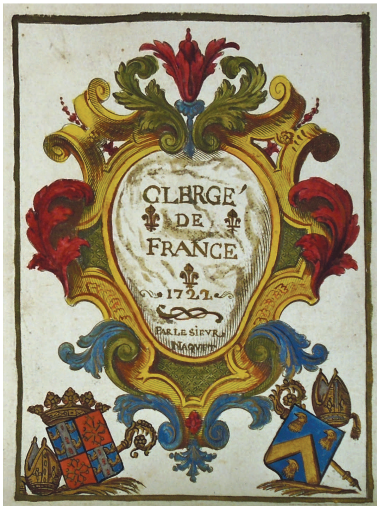
III. 6. Alexis Naquet, Clergé de France , 1722. Page de titre, dessin, 1722. British Library, 1570/5984.

avant de se rendre compte qu'il était cardinal (ill. 4). Certaines erreurs auraient pu causer des problèmes en ce qu'elles remettent en cause certaines dignités : les archevêques de Tours, Albi et Toulouse se voient ainsi privés sans raison de leur croix de procession à double traverse... et donc rabaissés au rang de simple évêque (BnF).