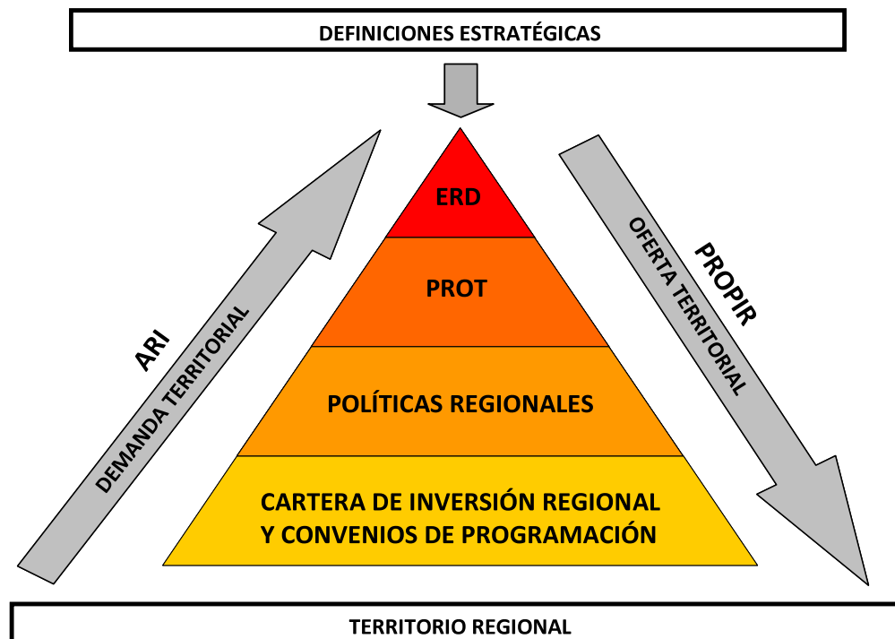
Figura 2. Esquema del Sistema Regional de Planificación