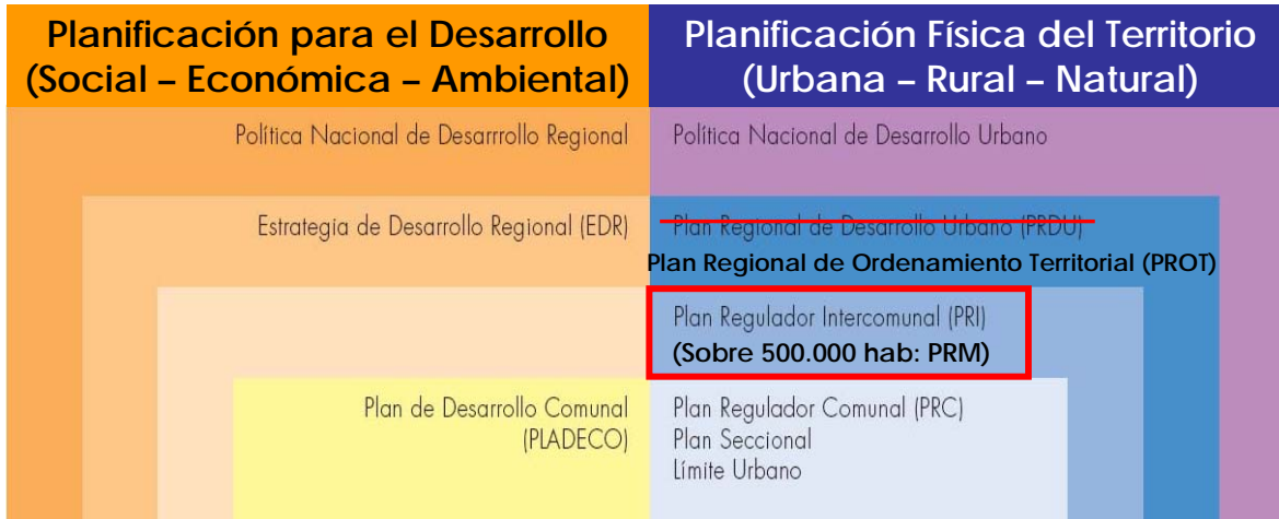
Figura 1. Relación de escalas según instrumentos de carácter estratégico y territorial