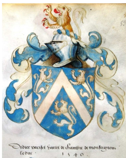
p. 53 (dét.)