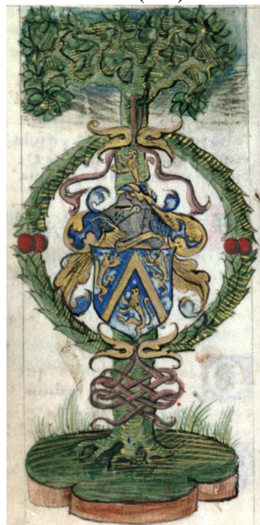
f. 13 v°