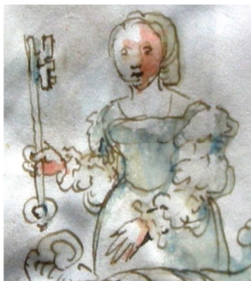
p. 4 (dét.)

Besançon, Bibliothèque municipale, ms. 159