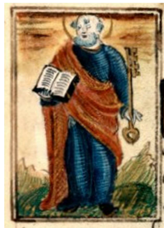
f. 20 (dét.)