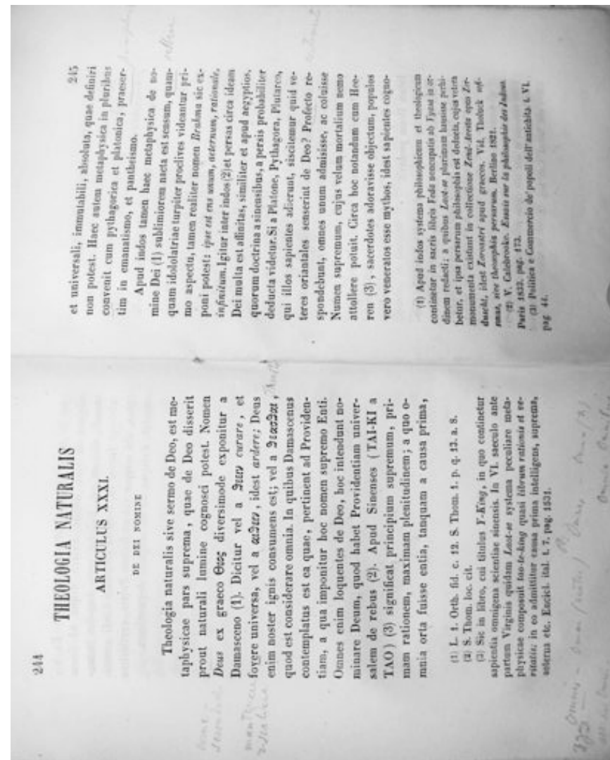
Illustration 2 : F. Hyacintho de Ferrari, Philosophia Thomistica qua veteris ac novae scholae doctrina analytice expenditur , Rome, Typographia scientiarum, 1851, Vol. 2, p. 244-245.