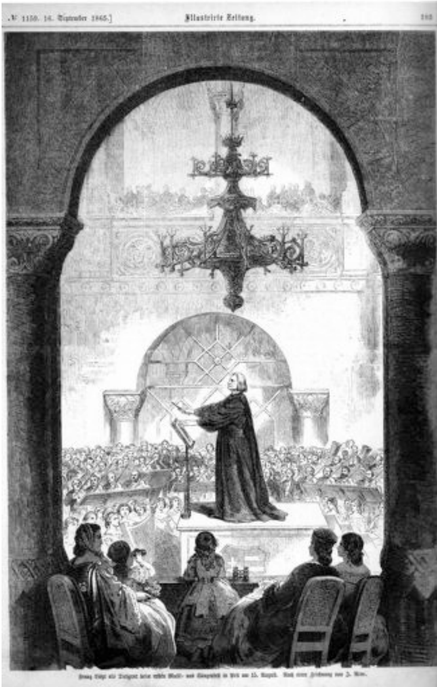
Illustration 1 : Franz Liszt dirige la première de Die Legende von der heiligen Elisabeth , Illustrierte Zeitung , n° 1159, 16 septembre 1865, p. 193.