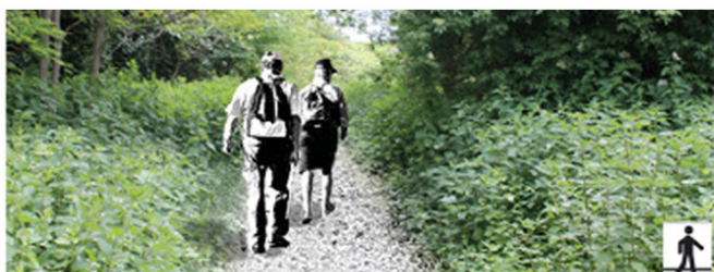
Les sentiers des berges seront fauchés deux à trois fois par an, en prenant soin de préserver les masses végétales de part et d'autre du cheminement.

ou à envisager des lieux spécifiques (vallée du Dropt ou de la Gardonnette, coteaux du Sigoulés, ...) comme des « trésors paysagers » à préserver et à valoriser. Les propositions d'action qui relèvent de ce registre-là s'établissent à l'échelle de l'ensemble du territoire concerné par le SCoT ou à celle de situations paysagères particulières. Elles affirment la nécessité d'aller à l'encontre de la banalisation des paysages afin de garantir au Bergeracois la richesse de son cadre de vie actuel et futur. Elles sont susceptibles de permettre la construction collective d'une identité territoriale du Bergeracois, construction qui reste à l'heure actuelle encore très partielle, mais dont la réussite constitue sans aucun doute un élément clef du succès de la démarche de SCoT.