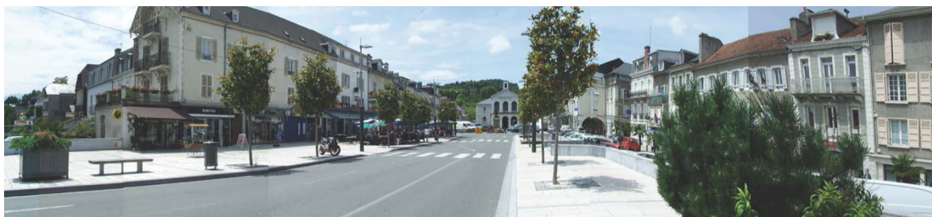
L'héritage des bastides est fortement présent dans des paysages urbains bien ordonnancés où la place centrale joue un rôle structurant.