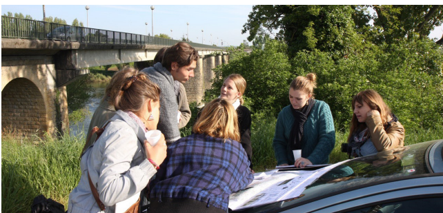
Une « lecture du paysage » fondée sur un important travail d'observation/interprétation des situations paysagères et de leurs dynamiques.

les étudiants ont-ils proposé différentes manières de « lire les paysages » du Bergeracois et de réfléchir à leur devenir, à partir d'une approche transversale multidimensionnelle, à la fois spatiale, temporelle et sociale. Ils se sont attachés à articuler les échelles spatiales pour mettre en forme une compréhension des paysages et envisager l'action à différents niveaux entre le local et le régional. Ils se sont intéressés aux évolutions paysagères, faisant du passé un support de compréhension du présent et envisageant sur ces bases les transformations à venir, possibles ou souhaitables. Ils ont considéré la dimension sociale des paysages en enquêtant auprès des acteurs locaux considérés comme étant pourvu d'intentions et de capacité à agir et dont il s'agit de prendre en compte les représentations, les logiques et les conflits d'intérêt éventuels. Ils ont également rencontré les habitants, prenant en compte leurs attentes et faisant en sorte qu'ils participent aux décisions relevant de leur cadre de vie et de leur bien-être.