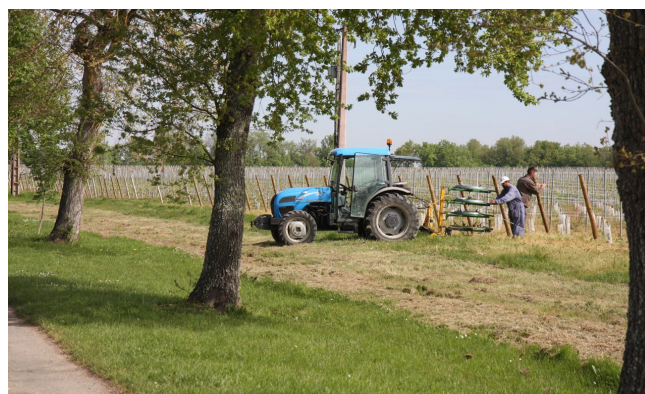
Les pratiques agricoles doivent être prises en compte dans un projet de paysage construit à partir d'une vision territoriale partagée.

L'originalité d'un projet de paysage défini de cette façon repose sur sa capacité à fédérer, autour d'une vision forte de la mutation de l'espace territorial, les différents registres opérationnels : identification d'ensembles territoriaux pertinents, compréhension et mobilisation des dynamiques, y compris celles à l'œuvre dans la société locale, à l'œuvre dans ce territoire, conception de situations paysagères, formulation de réponses spatiales et formelles cohérentes aux différentes échelles, mise en œuvre de modes d'actions très diversifiés.