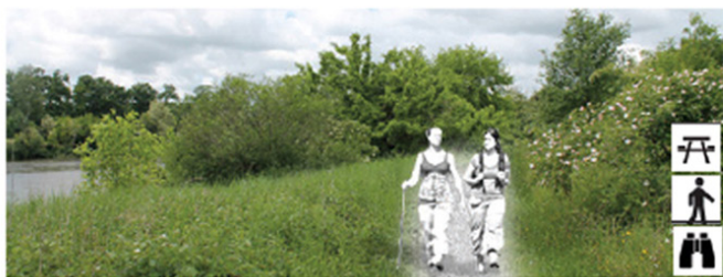
Les fenêtres paysagères devront être préservées et entretenues, avec la suppression des ligneux. Des points d'arrêt pourront être aménagés pour l'observation.