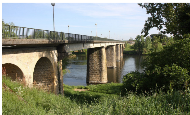
Le projet de paysage est un processus qui doit s'inscrire dans une réalité territoriale complexe, dans laquelle les acteurs et les habitants sont en position centrale.

Pourtant, la place du paysage dans les démarches de projet de territoire reste encore à clarifier et à construire. Le paysage est souvent présent dans les études préalables ou dans les diagnostics, mais il y apparaît au même rang que d'autres thématiques d'études participant de l'état initial de l'environnement. En ce sens, il s'entend généralement comme une analyse visuelle et descriptive aboutissant à la délimitation d'entités paysagères. On obtient alors en terme de préconisation un simple zonage qui, sous une forme cartographique, signale les points noirs paysagers ou fixe les zones à protéger et celles à valoriser. Toute l'ambition présente est de réussir à dépasser cette manière de faire pour considérer le paysage comme un objet à construire ensemble. Cette construction ne va pas de soi. Elle nécessite de rendre compréhensible l'ensemble du territoire dans lequel nous vivons et avec lequel nous établissons un ensemble de relations liées à l'habitat, au déplacement, à la production, au loisir, au rêve, etc. Sur ces bases, la démarche paysagère visera d'abord à proposer une autre manière de lire et de réfléchir au territoire et à son devenir, à partir d'une approche transversale à différentes thématiques – agriculture, patrimoine, développement péri-urbain, ... – et à caractère multidimensionnelle : spatiale, temporelle et sociale.