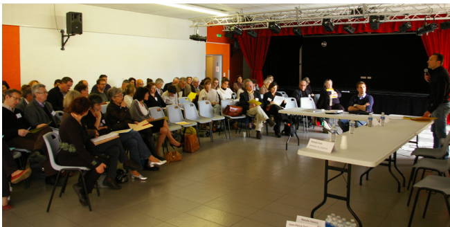
La matinée en salle a permis de partager différentes expériences sur le thème « Paysage et projet de territoire ».

L’après-midi sur le terrain a été l’occasion d’échanger en parcourant les paysages du Bergeracois, territoire où une démarche SCoT était en cours et qui, en parallèle, constituait un lieu d’expérimentation d’un processus de projet de paysage pour les étudiants-paysagistes de l’ensapBx. Ce dossier est l’occasion de faire un retour réflexif sur ces démarches et de présenter quelques uns des résultats obtenus.