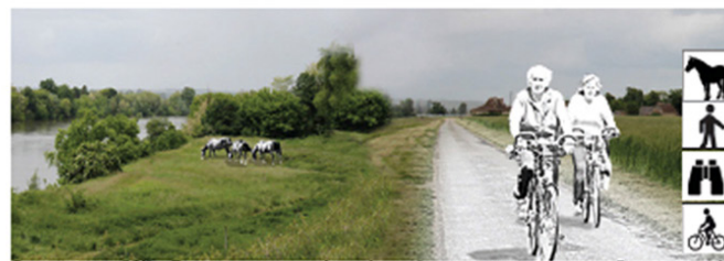
Le projet « Vélo-Route » sera aménagé sur les routes existantes. La traversée sera rythmée par : les ambiances de la Dordogne, les prairies humides pâturées et les cultures variées des plaines.

Les berges de la Dordogne sont susceptibles d'accueillir des aménagements favorisant des pratiques sociales, tout en préservant les continuités écologiques.