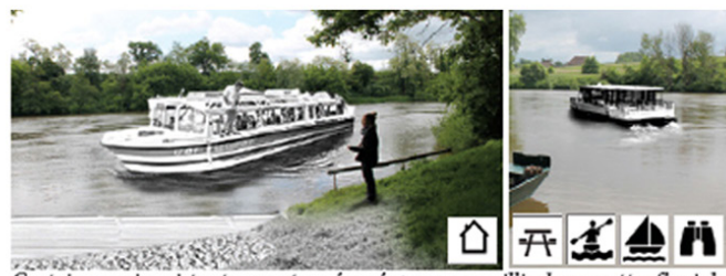
Certains quais existants seront aménagés pour accueillir des navettes fluviales qui permettront la traversée du fleuve. Les berges devront être stabilisées par la mise en place de gabions ou de fascines afin de lutter contre le battillage.