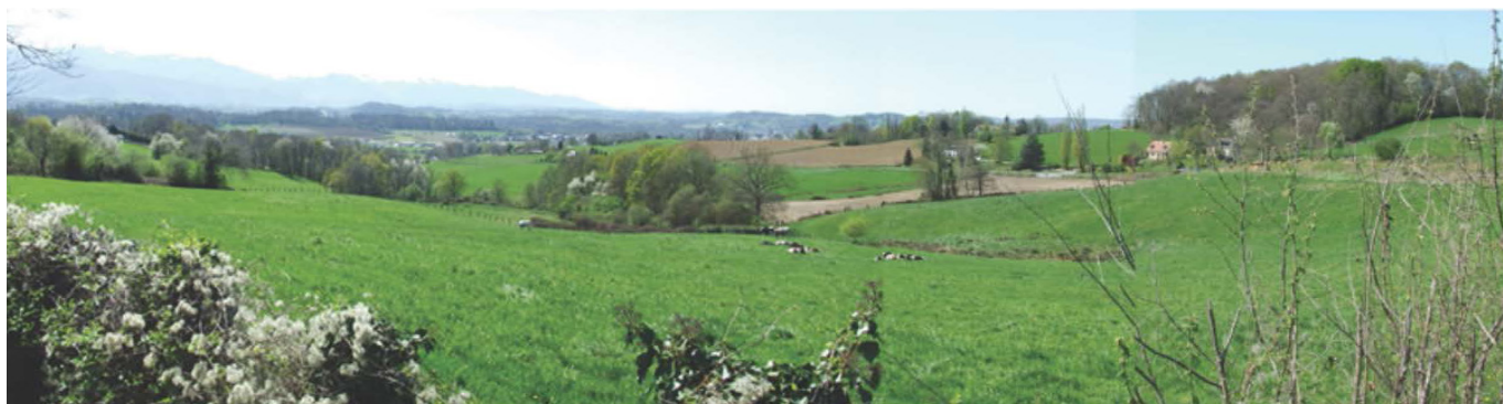
On trouve dans l'Entre-deux-gaves une qualité paysagère fondée sur un caractère rural affirmé.

s'appuyer sur des orientations partagées. La question paysagère a été mise au coeur des débats engagés par les différents acteurs à l'occasion du diagnostic de cette charte. Ce temps d'échange en commission a permis de confronter des visions du territoire entre plaine coteaux. La sensibilisation s'est poursuivie dans le cadre du lancement du SCoT rural engagé en Juillet 2012 afin d'inscrire le paysage comme un des vecteurs de développement territorial. Entre planification urbaine et projet de développement, le territoire est aujourd'hui engagé dans un plan de paysage lancé en 2014, suite à l'appel à projet du ministère de l'écologie, du développement durable et de l'énergie.