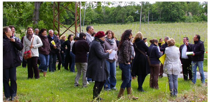
L’après-midi, l’échange entre les participants s’est effectué sur le territoire du SCoT du Bergeracois où une démarche paysagère menée par les étudiants-paysagistes de l’ensapBx était en cours.