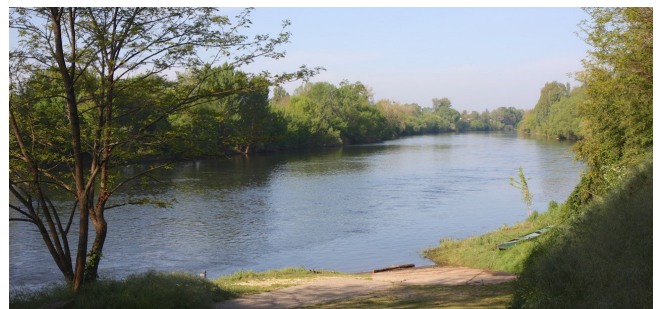
Les territoires riverains de la Dordogne et de ses affluents offrent une diversité de milieux et une richesse paysagère notable.