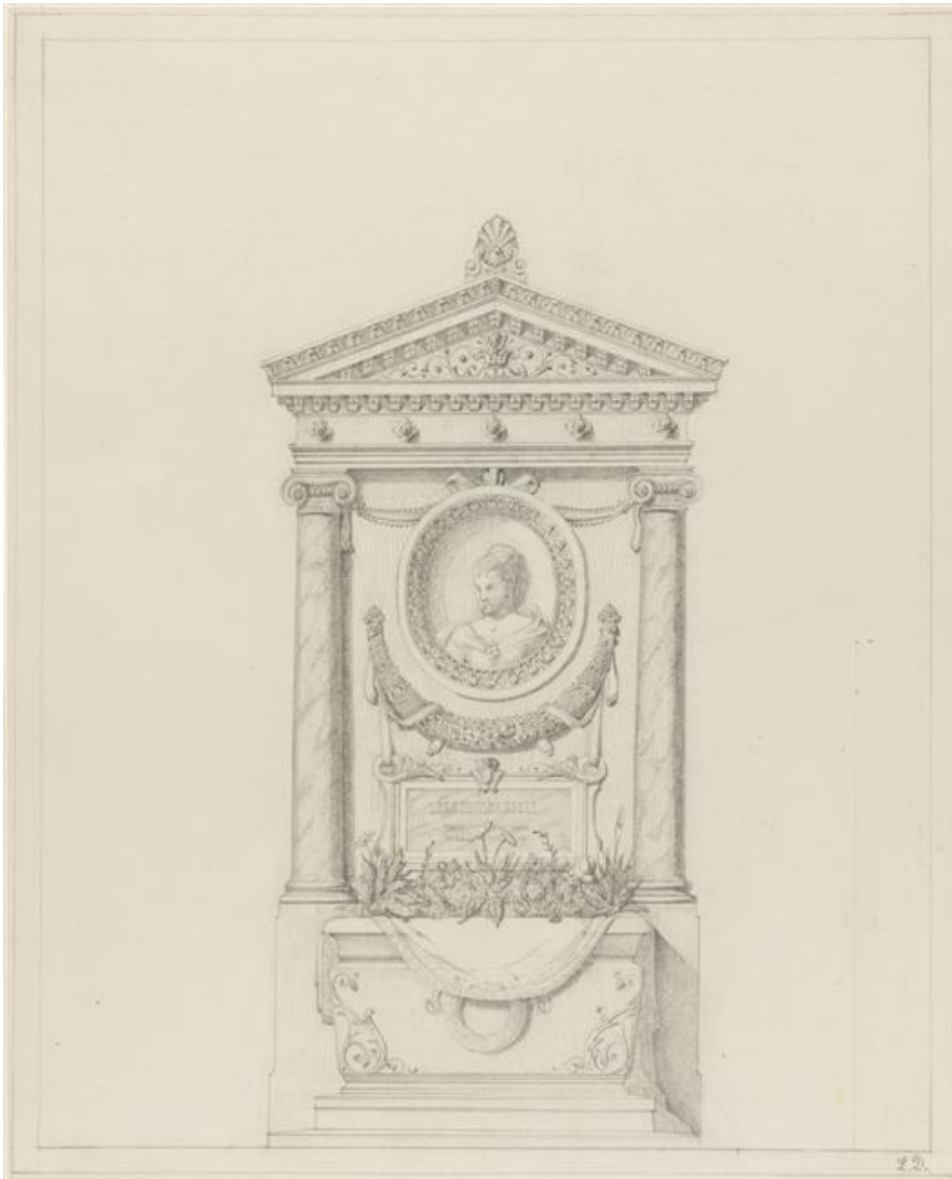
fig. 1. Laure Labrouste, monument funéraire dédié à une femme. (s.d.) Musée d'Orsay, ARO 2009-49.

Laure privilégie la voie biographique pour démontrer la fécondité de l'école « logicienne » ouverte par son père, et ce jusqu'au début du xx e siècle.