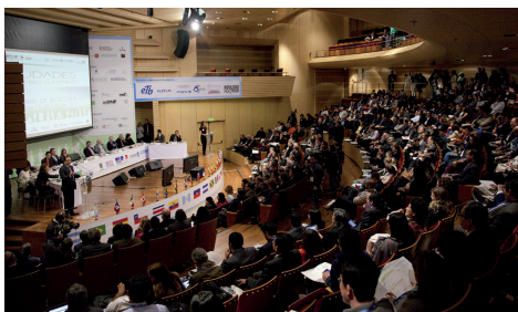
Cérémonie d'ouverture du Sommet de Bogota

en la matière, notamment en incluant les citoyens et communautés locales. Les métropoles de la région ont exprimé à de nombreuses occasions, et ont répété lors du Sommet de Bogota leur volonté de travailler conjointement pour faire face aux défis du changement climatique. Dès lors, dans le cadre du Sommet, 17 nouvelles villes ont décidé de signer le Pacte de la ville de Mexico contre le Changement Climatique et plus de 25 villes latino-américaines ont signé la Déclaration de Bogota « Villes Humaines face au Changement Climatique ». ■