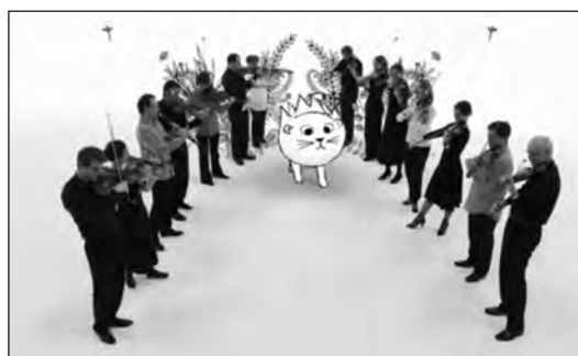
Le Carnaval des animaux, conçu et réalisé par Gordon et Chloé Jarry, illustré par Emmanuelle Tchoukriel, Camera Lucida production, France Télévisions Distribution et Radio France.

restent toutefois exceptionnelles dans la production, au point qu'elles font l'objet d'annonces sur les blogs du domaine.