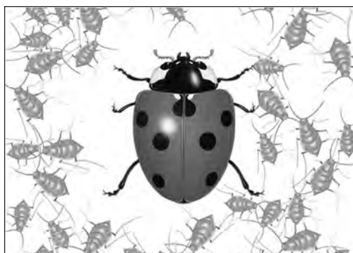
Application pour iPad de La Coccinelle , Gallimard Jeunesse (Mes Premières découvertes)