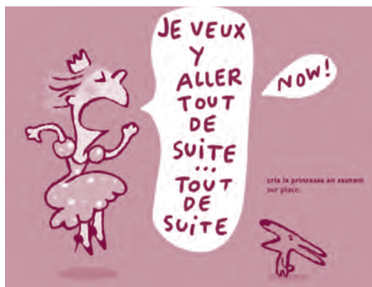
Les Histoires de lapin, de Soledad Bravi, Europa Apps