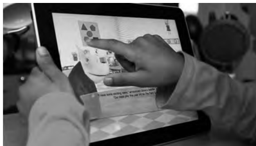
Application iPad, d' Olivia Acts Out , Polin8, d'après les albums de Ian Falconer

Dans ce domaine, l'édition jeunesse et la bande dessinée font figure de pionniers en expérimentant les enrichissements apportés par le numérique – offres qui