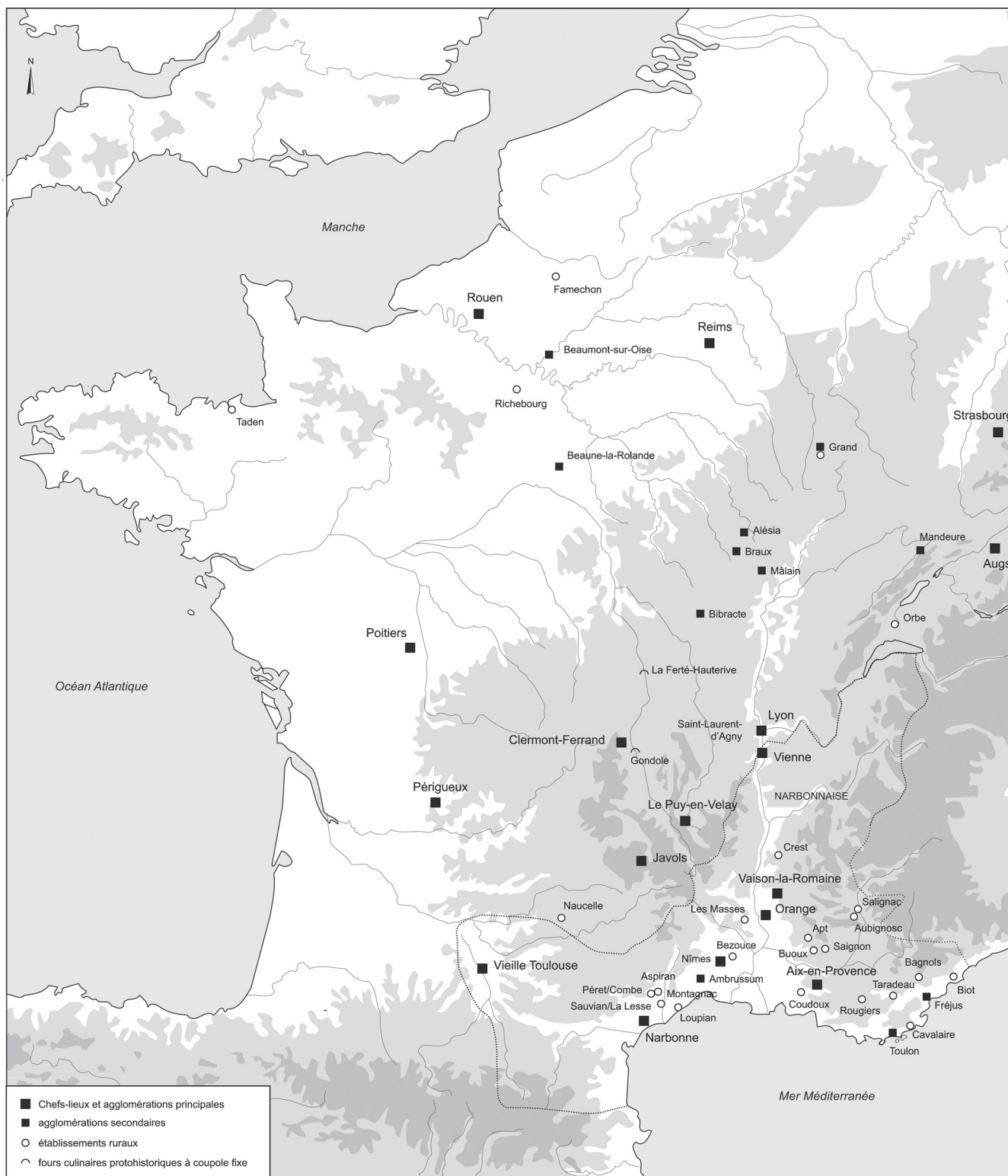
Fig. 1 – Carte de localisation des sites mentionnés dans le dossier (DAO : M. Poux, Université Lumière Lyon-II).

Gaules (Bourges, Rouen, Mâlain, Braux, Reims, Bliesbruck, Grand, Strasbourg, Augst...) parlent d'elles-mêmes 2 . Elles dessinent en filigrane la carte du processus de romanisation