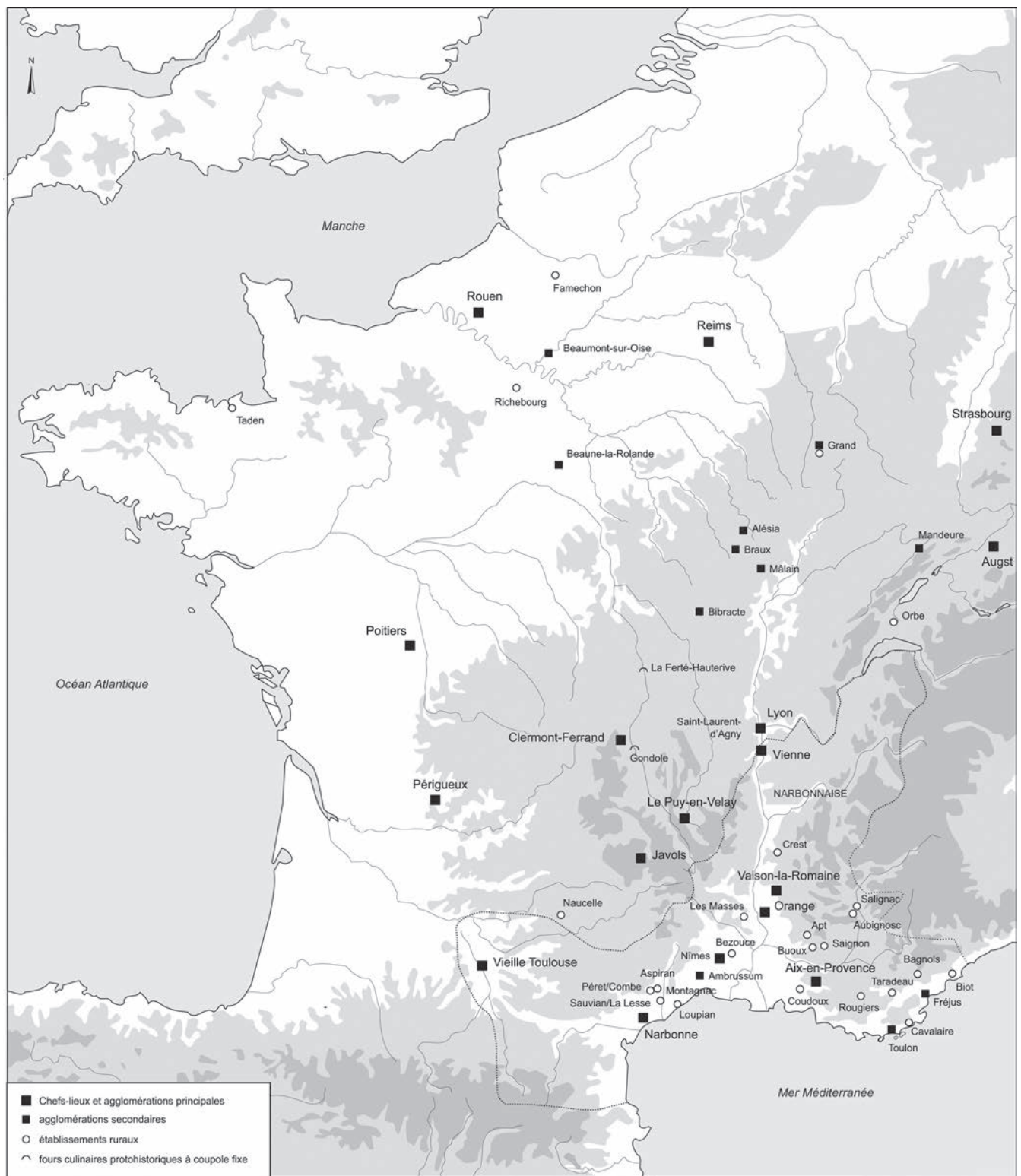
Fig. 1 – Carte de localisation des sites mentionnés dans le dossier (DAO : M. Poux, Université Lumière Lyon-II).

Gaules (Bourges, Rouen, Mâlain, Braux, Reims, Bliesbruck, Grand, Strasbourg, Augst...) parlent d'elles-mêmes 2 . Elles dessinent en filigrane la carte du processus de romanisation