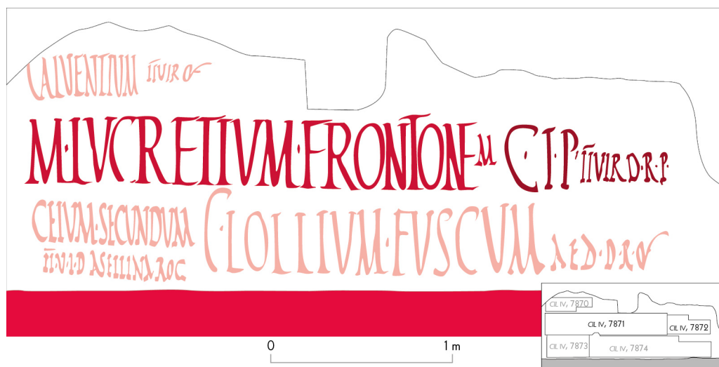
Fig. 5. Façade la maison IX 11, 3. L'inscription CIL , IV, 7871 paraît avoir respecté CIL , IV, 7872, probable témoignage d'une alliance entre M. Lucretius Fronto et C. Iulius Polybius pour la brigade du duumvirat [DAO et mise à l'échelle N. Monteix, d'après cliché SANP (ex P 717)-C446, pris en 1912 (cf. Varone & Stefani 2009, 429)].

Suite à la découverte de nombreux placards en façade de la maison IX 13, 1-3, M. Della Corte a proposé de voir en C. Iulius Polybius le propriétaire de la maison (fig. 6) 33 . Pourtant, certaines inscriptions lues après la fouille de l'intégralité de la maison dans les années 1970 renvoient vers C. Iulius Philippus, possible affranchi impérial 34 . Son sceau en bronze a été découvert rangé dans un meuble du péristyle 35 ; dans un graffiti, inscrit sur le laraire situé dans la cuisine de cette maison, P. Cornelius Felix et Vitalis exprimèrent des vœux pour le retour sain et sauf de Philippus d'une probable campagne militaire, ce qui arriva 36 . En face de la maison, un placard électoral pour un candidat au nom mutilé s'adressa à Philippus : s'il faisait élire le candidat, ce dernier ferait de Polybius son collègue 37 . Cette affiche, véritable propagande ad personam , oblige à considérer que Philippus pouvait lire cette invite pendant l'une des campagnes de Polybius. Cette présence dominante de Philippus ne réduit pas la fréquentation de la maison par Polybius à néant : directement interpellé par A. Rustius Verus pour faire voter pour lui, son nom pourrait avoir été exploité comme rogator fictif par le même et par un certain Severus 38 . Plus complexe est