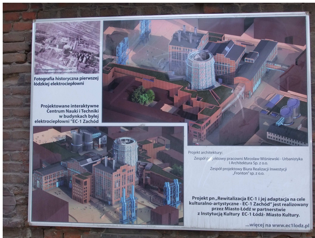
Fig 5. Extrait du projet du Nouveau Centre de Lodz avec la tour EC 1