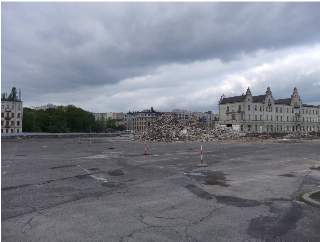
Fig. 4. La gare centrale Łódź Fabryczna, avant sa démolition

intermédiaire, mi-privé mi-public, que constitue le rynek 15 de Manufaktura à de multiples occasions a montré sa capacité à être un espace public de fait, à abriter de grandes festivités collectives, grâce à son aménagement soigné et chaleureux, ses nombreuses terrasses de café, ses bancs...mais il est juridiquement privé, et des vigiles sont là au quotidien pour contrôler les pratiques sociales. La place est en effet libre pour une centralité culturelle dans l'espace urbain. Elle est « physiquement » d'autant plus libre que la démolition rapide de la gare et la gigantesque excavation préparant l'enfouissement des voies ont supprimé les formes matérielles de cet ancien quartier de gare. Le projet ferroviaire est moins complexe politiquement, mais davantage techniquement, et très incertain quant à ses temporalités ; il apparaît en tout cas déconnecté du projet culturel : deux processus de renouvellement urbain se déroulent en parallèle, sans pour l'instant se croiser, avec des temporalités décalées qui entravent leur enrichissement mutuel.