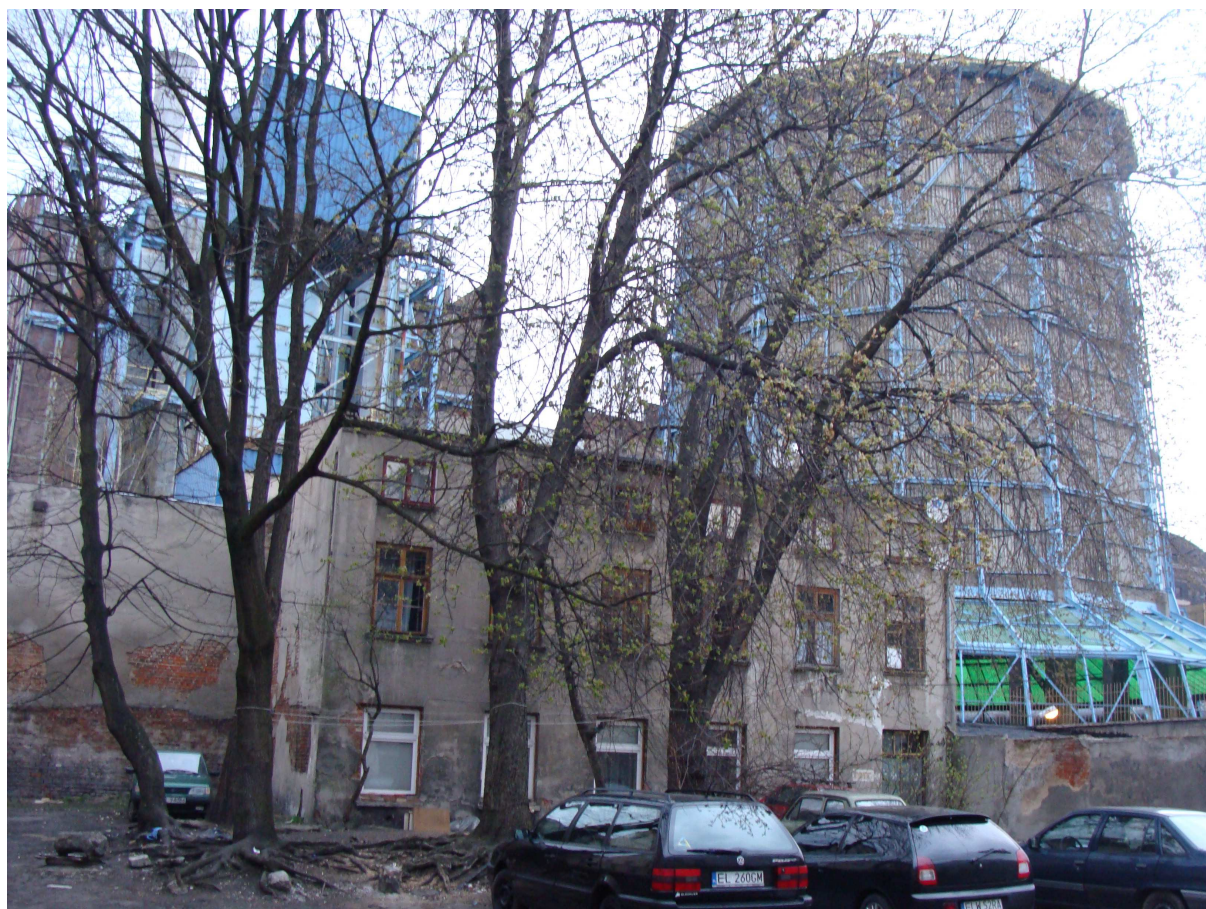
Fig. 3. La tour de l'EC 1 Photo LCdL 2010

comprend une « zone artistique et culturelle spéciale » 13 , un centre de festivals et de congrès, un musée scientifique, des studios de sons et d'image, etc. (figures 1 et 3).