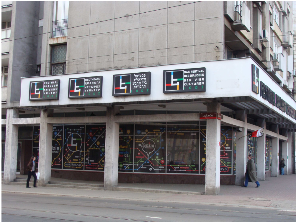
Fig. 2. Le siège du Festival du Dialogue des Quatre Cultures

Cette réalité est incarnée dans le « Festival du dialogue des quatre cultures 4 » qui célèbre chaque année depuis 2002 la création artistique juive (via des artistes venus d'Israël ou d'autres pays), polonaise, russe et allemande, à travers des spectacles vivants et des expositions (figure 2). De même, un des projets urbanistiques du centre-ville propose l'ouverture de quatre nouvelles rues, elles aussi au nom de ces cultures 5 . Mais l'articulation entre revitalisation de friches urbaines et promotion de Łódź comme ville de culture s'est concentrée du côté de la gare principale de la ville.