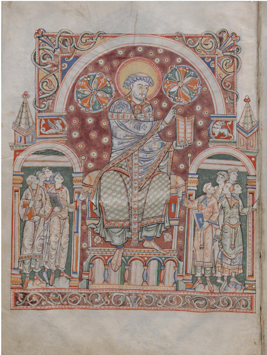
Figure 5 - Firenze, BML, Plut. XII.17, f. 3v