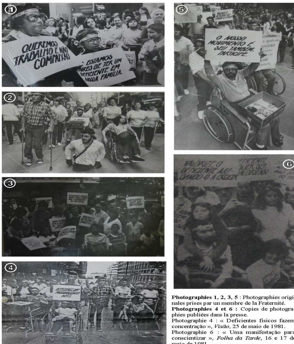
Photographies 1, 2, 3, 5 : Photographies originales prises par un membre de la Fraternité. Photographies 4 et 6 : Copies de photographies publiées dans la presse. Photographie 4 : « Deficientes físicos fazem concentração », Visão , 25 de maio de 1981. Photographie 6 : « Uma manifestação para conscientizar », Folha da Tarde , 16 e 17 de maio de 1981.

Source : Archives de la FRATER (Porto Alegre), carton Ano Internacional das pessoas deficientes.